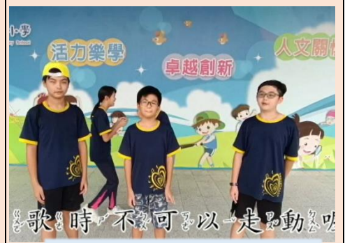
介紹敬愛國歌、國旗的禮儀

小市長團隊於國慶日前夕拍攝宣傳影片，介紹國旗各元素的涵義、國慶日慶祝活動，及敬愛國歌、國旗禮儀等。期透過國慶日宣導影片，使小朋友更了解雙十國慶，一同慶祝這個國家最重要的節日。