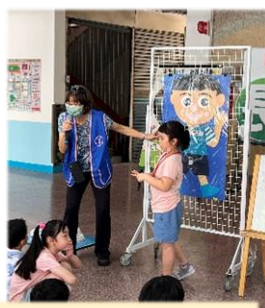
安排衛教宣導和生活指導，協助孩子適應學校生活