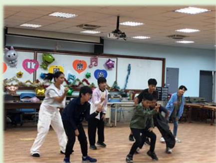
學長姐動感十足的表演

113年10月11日國樂團辦理迎新活動，熱情歡迎117級學弟妹加入國樂家族。溫馨的活動中，同時也發現國樂大家族的孩兒們，個個身懷絕技能舞能演，毫不怯場。原來，充滿安全感的溫馨環境下，每一個國樂家族的孩兒都能盡情展現揮灑！