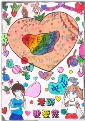
學生用心製作敬師卡片

為迎接 928 教師節的來到，輔導處於 113 年 9 月 10 日至 9 月 27 日辦理教師節系列活動。以「愛師賓果樂」和「教師節慶祝會」，搭配「愛的九宮格」、「愛的留言」，以及各班代表製作敬師卡片等活動，讓學生透過行動對老師表達感恩與祝福。