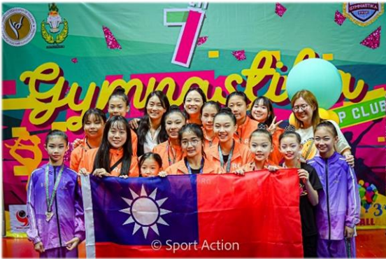
中正韻律體操小小國手技冠群雌

暑假期間於 113 年 07 月 12 日至 14 日，本校韻律體操隊學姐們出國參加「2024 泰國曼谷韻律體操國際邀請賽」，和國外選手們同台競技，勇奪佳績。