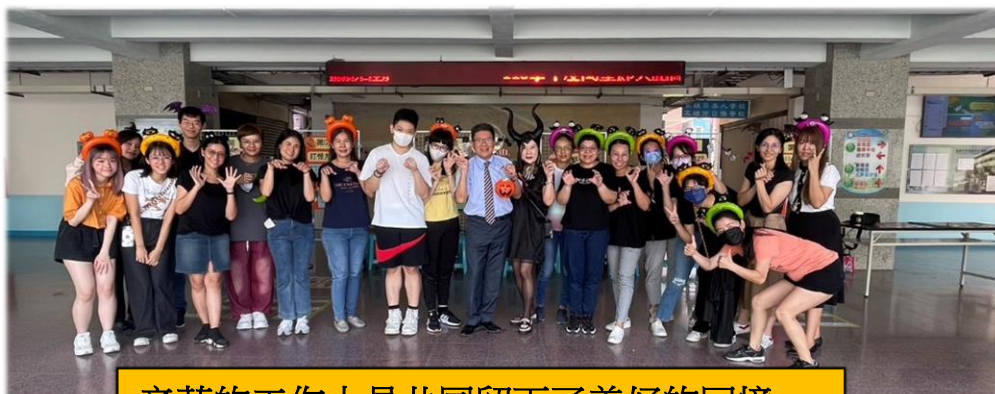
辛苦的工作人員共同留下了美好的回憶