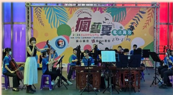
介紹國樂器，有獎徵答觀眾反應熱烈

國樂團暑假期間於113年7月11日參加「2024高雄瘋藝夏-魔法舞台」，在美麗島捷運站「光之穹頂」演出，表演主題「樂團飄香-夏日樂悠悠」。孩子們以大眾耳熟能詳的活潑好聽歌曲，帶領聽眾們體會傳統國樂與現代音樂結合之美。