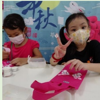
中秋節~月兔袋子創作