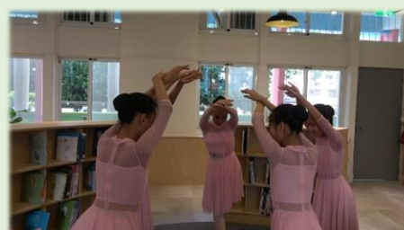
優雅翩然的芭蕾舞讚