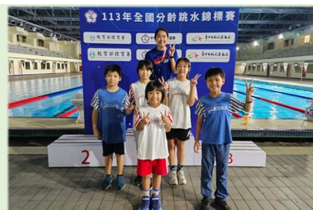
中正國小跳水隊健將合影