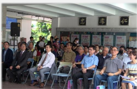
典禮會場冠蓋雲集