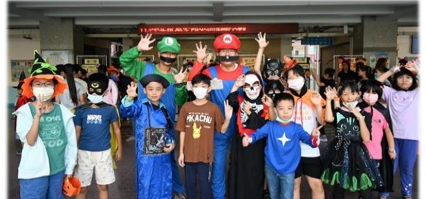
創意打扮的小朋友與瑪利兄弟合照