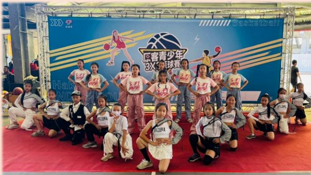
六年級於原客青少年三對三籃球賽開幕演出