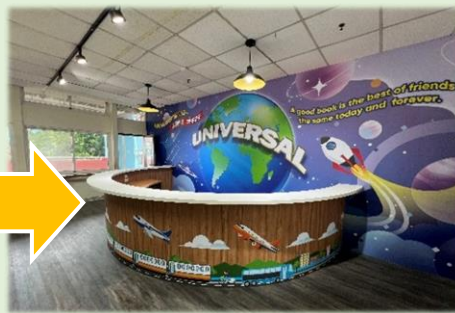
改裝後煥然一新，櫃台亮麗整潔