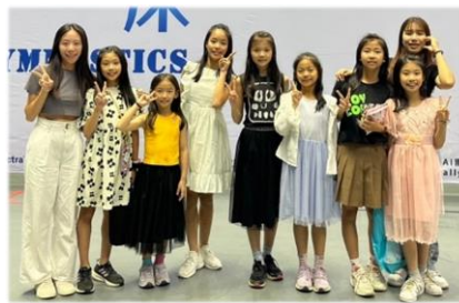
打扮美美參加選手之夜