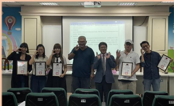
頒發副會長當選證書