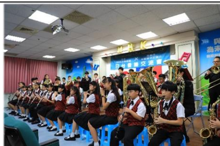
NHK 銅管老師、陳校長、五六年級學生們一起合奏《崖上的波妞》