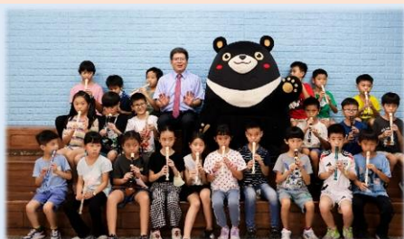
欣賞管樂班小朋友吹直笛