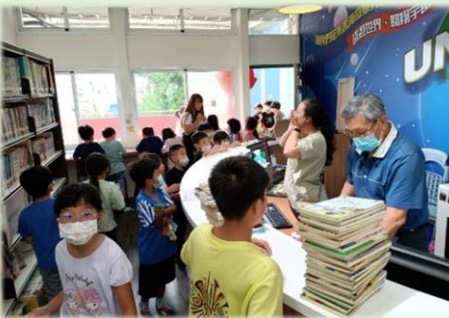
借書的學生絡繹不絕