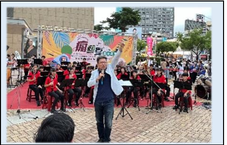
校長代表中正管樂團致詞熱場