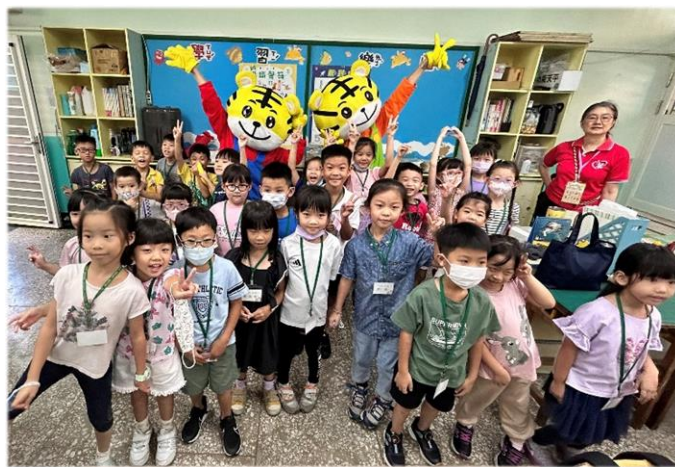
巧虎的出現，讓學生嗨翻天！