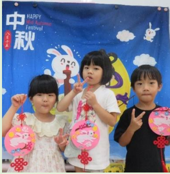
中秋節~我的月兔掛飾

開學到現在，我們認識了中秋節和國慶日，每個節日都有它在文化傳承上的意義，老師設計相關活動，以簡易的故事分享、美勞創作，讓小朋友認識不同的節慶故事，進而認同自我的文化。