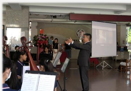
校長親自指揮國樂團開幕演出