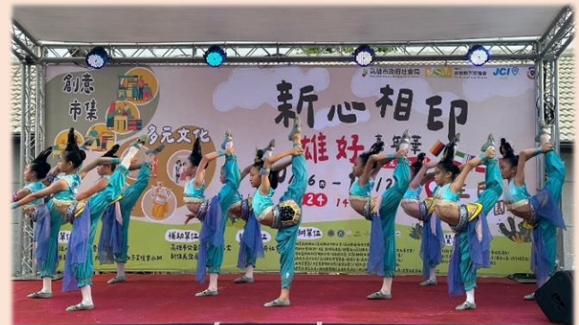
六年級於青商會「新心相印雄好嘉年華」演出