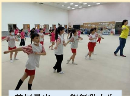
美好晨光，一起舞動人生