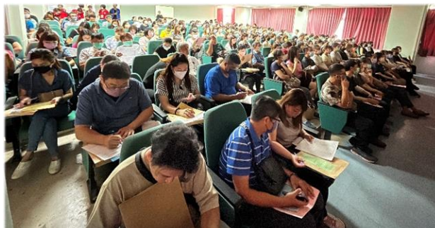
新生家長座談會座無虛席，家長認真聆聽作筆記