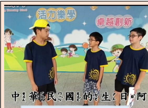
小市長團隊介紹雙十國慶