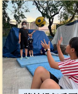
將枯燥但重要的體能課趣味