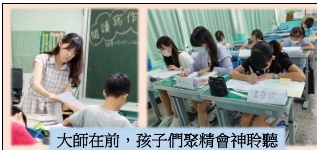
大師在前，孩子們聚精會神聆聽