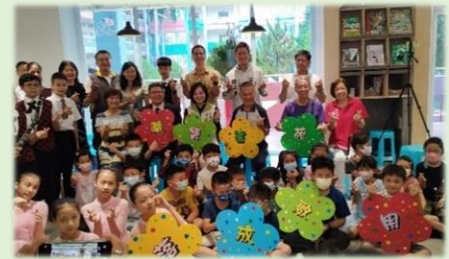
全體與會人員開心合影