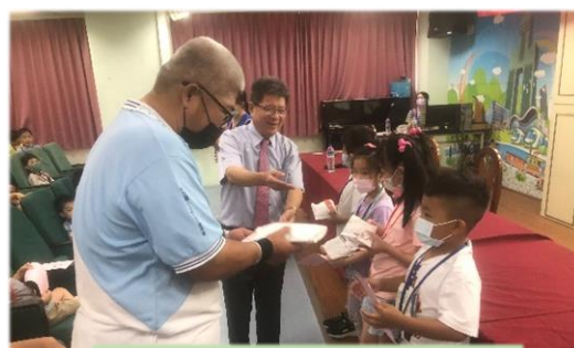
校長和會長送新生智慧筆