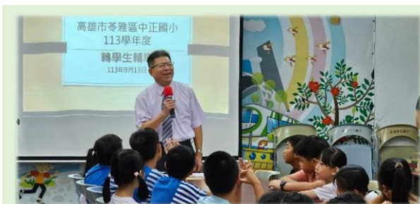
校長親切與同學互動

本學期共有 47 名同學轉入本校就讀，輔導處於 113 年 9 月 13 日辦理轉學生輔導活動，介紹校園環境及學校活動，協助新同學認識學校，校長也和同學分享如何學習與適應，鼓勵小朋友們勇敢迎向新環境。