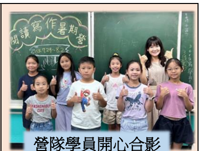
營隊學員開心合影

教務處特邀請本校語文專長，師鐸獎典範周文君老師，於113年7月29日至8月9日期間開辦【閱讀寫作一把罩】暑期營隊，以提升推廣閱讀與寫作；並透過公開成果展示，提升校內閱讀風氣。