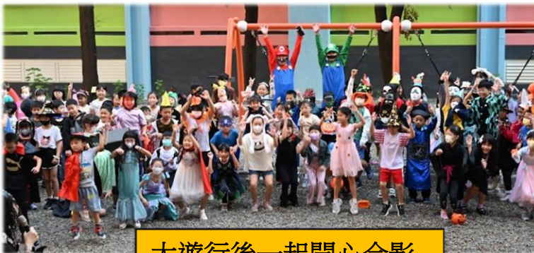
大遊行後一起開心合影