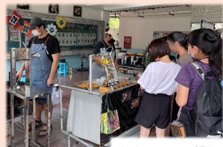
仔細思量，挑選最心儀的口味