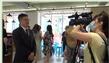
校長接受媒體採訪