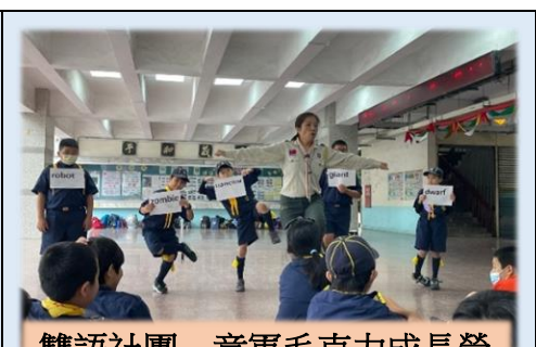
雙語社團—童軍毛克力成長營

為響應高雄市政府「校校有雙語」政策，本校以體育競賽類「韻律體操」、「棒球」，及休閒活動類「童軍」，為本學年度融入之社團主題，於113年7月1日至12日辦理雙語夏令營，為學生提供充滿樂趣與活力的雙語學習體驗。