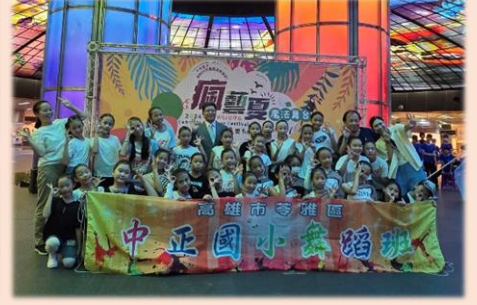
五、六年級參加「2024 高雄瘋藝夏-魔法舞台」演出