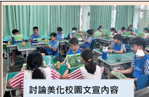
討論美化校園文宣內容