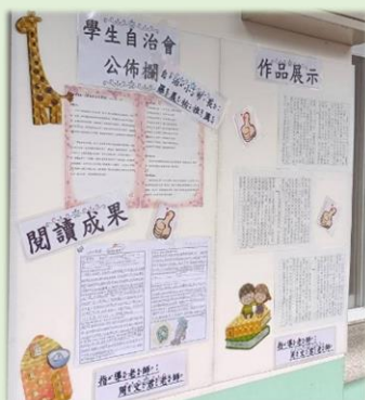
小市府好書好文分享