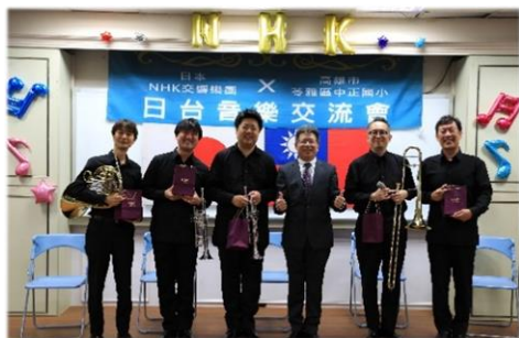
校長致贈紀念品與團員老師合照