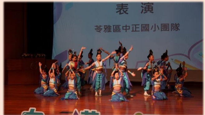
六年級於高雄市校長會議演出