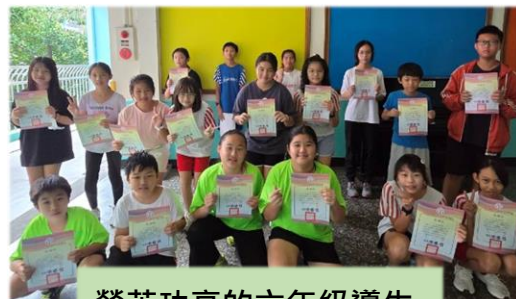
勞苦功高的六年級導生