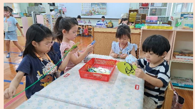
學習區操作、增進小肌肉的發展