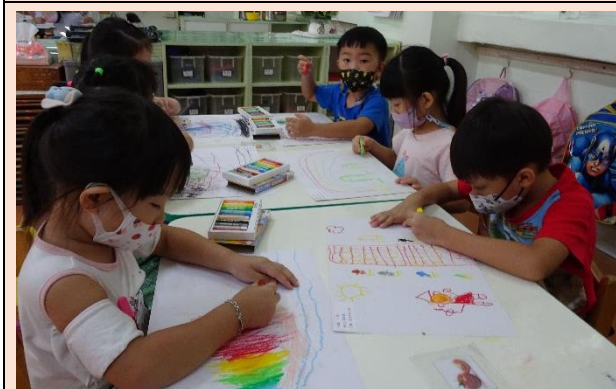
繪畫創作時間，很有自己的想法喔！