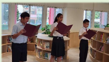
詩歌讚頌新書館的誕生