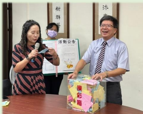
「校園就是一本書」抽獎活動開獎