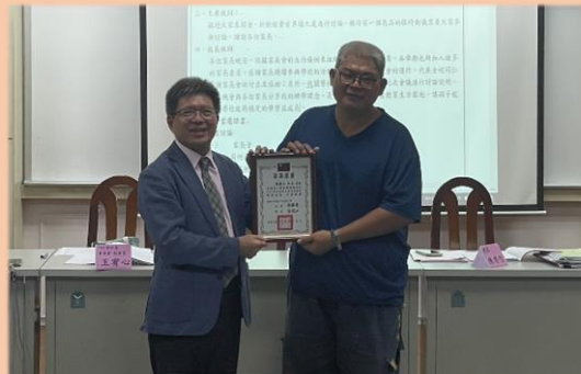
頒發會長當選證書