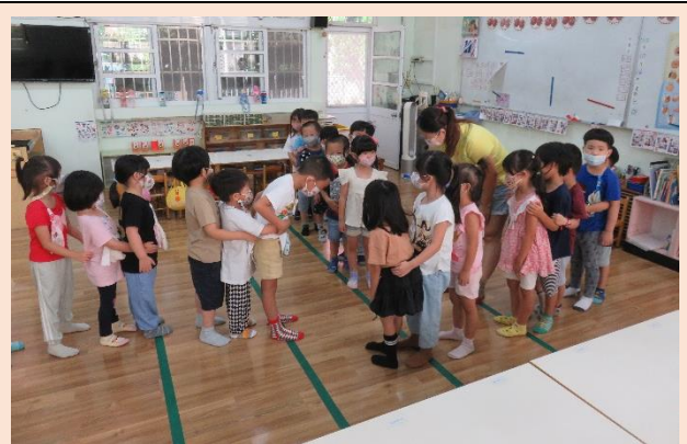
找朋友猜拳律動遊戲