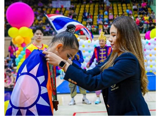
韻律天使勇奪佳績