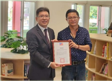
校長致贈感謝狀給監造單位 寰元室內裝修有限公司