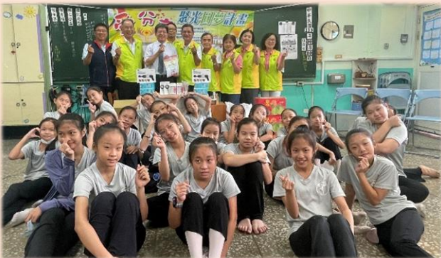
六年級參加救國團愛分享聚光圓夢計劃活動