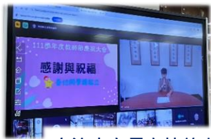
自治小市長主持線上教師節慶祝會