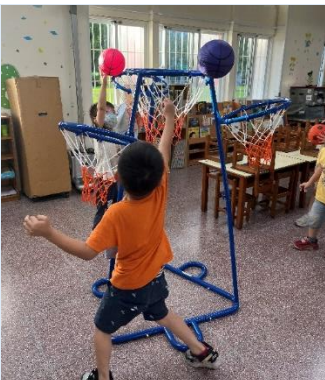
體能活動~我是籃球王