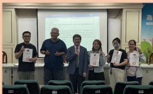
頒發常務委員當選證書