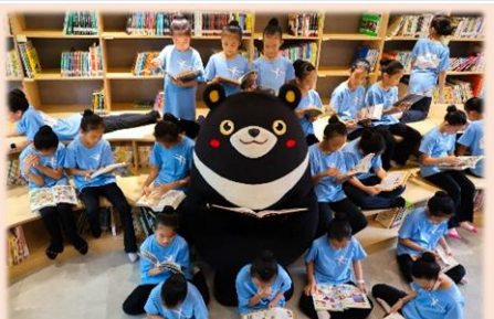
高雄熊參觀社區共讀站-藏寶書苑