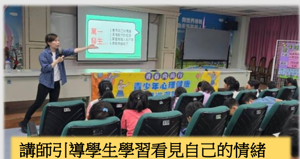
講師引導學生學習看見自己的情緒