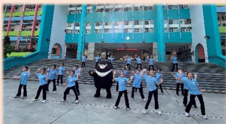
高雄熊和舞蹈班一起在校園各個美麗的角落尬舞