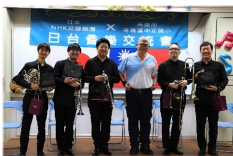
會長致贈紀念品與團員老師合照