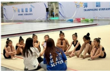
北上至桃園體育館移地訓練

本校韻律體操隊學姐們，113 年 08 月 19 至 23 日移地桃園進行技術交流及訓練，以提升韻律體操專項能力。同時，也參加 2024 閃耀盃國際體操邀請賽，和國外選手們同台競技，並參加好吃又好玩、美美的選手之夜，和各國選手交換異國小禮物。在台灣也可以和外國選手交流，是個新鮮有趣的經驗。