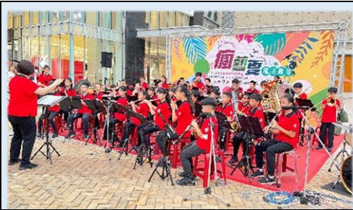
學生合奏多元豐富的曲目

管樂班於113年7月7日在漢神巨蛋廣場舉行的「2024 高雄瘋藝夏-魔法舞台」演出。以經典的管樂合奏曲、戲劇電影配樂改編曲、小朋友最愛的卡通歌曲及大眾喜愛的流行歌曲，為觀眾帶來一場豐富多元的音樂饗宴，陪大家渡過愉快的午後時光。