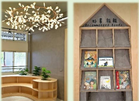
寬敞明亮的氣質圖書館