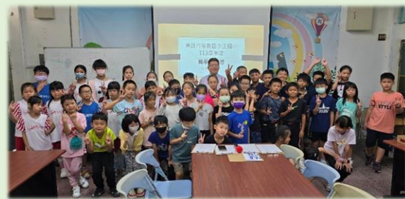
全體轉學同學與校長合照