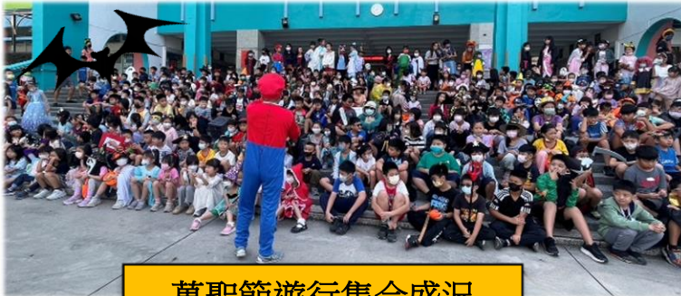
萬聖節遊行集合盛況

教務處偕同英語教學團隊於 113 年 10 月 30 日舉行 113 學年度英語日-萬聖節英語闖關活動。