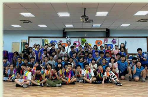
國樂大家族全體合影留念