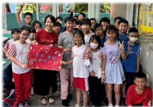
各班學生為老師奉茶，感謝老師的教導，師生開心合照。