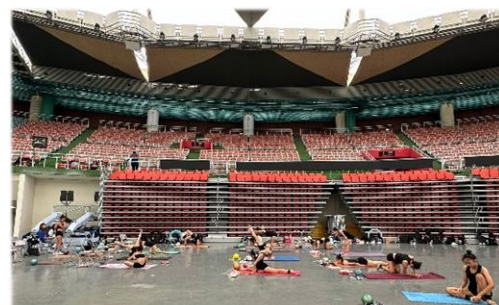
在超大體育館參加訓練及國際邀請賽