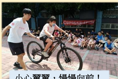
小心翼翼，慢慢向前！