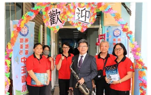
最有力的後盾-管樂家長後援會