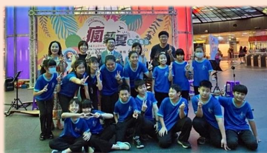
演奏完收工，又留下了一個美好的回憶