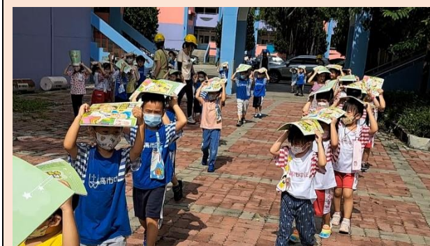
防災演練，練習保護好自己