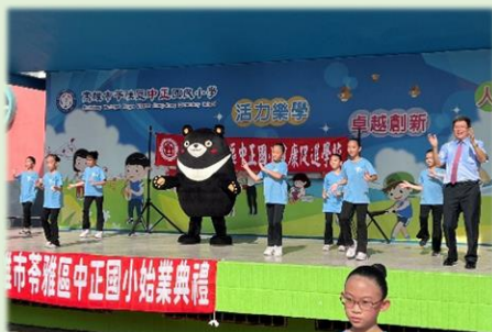
高雄熊和全校同學一起尬舞