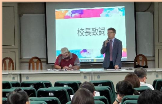
校長帶領各處室主任列席報告校務工作