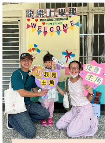
親師生活動時間，家長帶孩子逛逛校園，熟悉環境，並開心拍照留念。