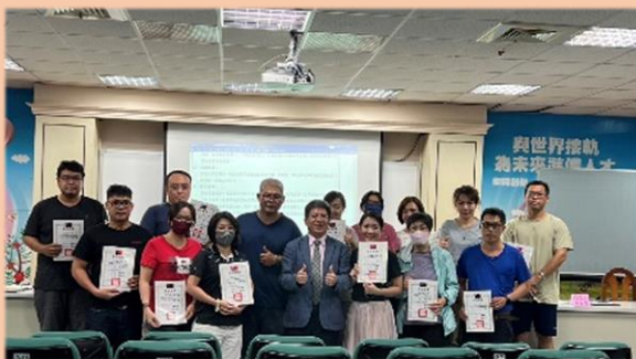
頒發家長委員當選證書