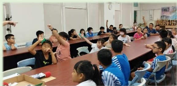
學生踴躍回答問題