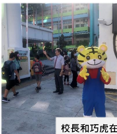
校長和巧虎在校門口迎接小朋友

113年8月30日一年級新生入學日。輔導處攜手一年級老師、課照班老師、家長志工及六年級導生，安排了多元的新生始業活動，並由小朋友喜愛的巧虎人偶出沒於校園中，為小朋友帶來驚喜，讓小小新鮮人第一天的上學日如探險般有趣。