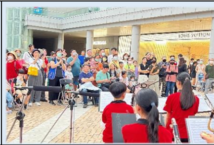
精彩的演出吸引民眾駐足聆聽