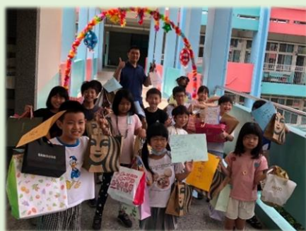
收穫滿滿且開心的學弟妹