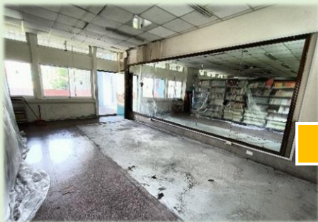
原本破舊極需修繕的二樓藏書閣

為了提倡閱讀，讓學生更方便利用圖書館，總務處於113年9月20日起進行忠孝樓二樓藏書閣閱讀環境友善活化規劃，完工後的圖書館舒適明亮，深受學生喜愛。配合藏書閣重新開張，教務處於113年10月15日至11月7日期間辦理閱讀抽獎活動，鼓勵小朋友們前來，發現這個幸福的小小閱讀角落，一起搭乘書海奇航列車，環遊世界、翱翔宇宙。