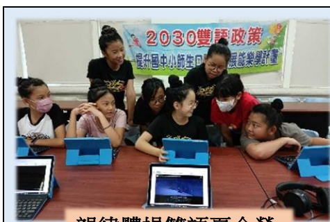
韻律體操雙語夏令營