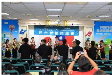
管樂班學生歡喜列隊吹奏迎貴賓

日本 NHK 交響樂團於113年8月24日蒞校，和本校管樂團進行「日台音樂交流會」，感謝日本台灣交流協會高雄事務所鼎力協助，促成活動且順利圓滿完成，更感謝日本 NHK 交響樂團團員老師，給小朋友們帶來了一堂別開生面的音樂課，通過音樂交流活動，無論在音樂素養和演奏能力等方面都得到啟發，並留下深刻美好的回憶。