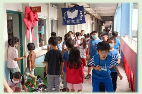
重新開幕的藏書閣門庭若市