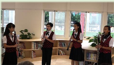
悠揚的管樂室內樂

及設計理念，並頒予工程監造單位感謝狀；接下來的詩歌朗誦，學生以創作文章，歌詠讚頌新生的藏寶書苑；最後由舞蹈班以美麗芭蕾舞翩翩起舞，表達對新書館的禮讚。