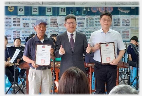
校長致贈感謝狀給施工青暉營造公司及監造祥騰工程顧問公司