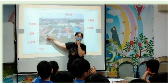
為新同學介紹學校環境