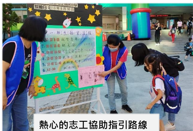
熱心的志工協助指引路線