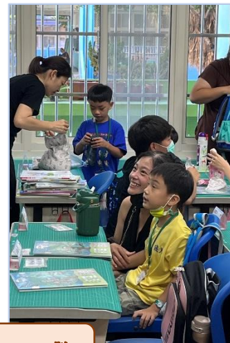
親師生教室裡相見歡