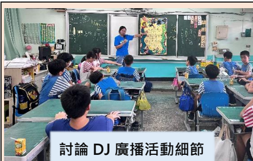
討論 DJ 廣播活動細節