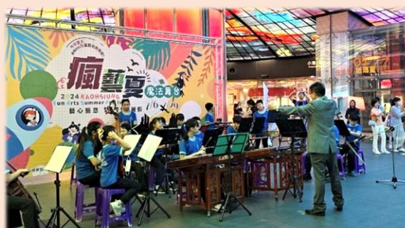
特邀神秘嘉賓-校長登場指揮