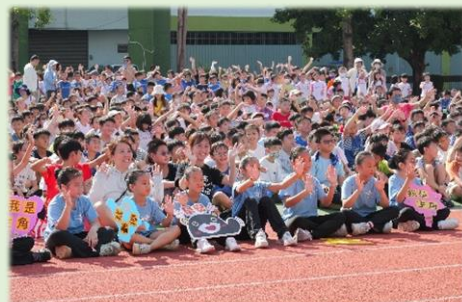
學生熱情回應嗨翻天