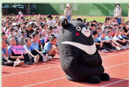
高雄熊和學生一起參加開學典禮

113年9月5日本校舉行了一個別開生面的開學典禮，除了大彩蛋-校長和管樂班同學表演薩克斯重奏外，更有神秘嘉賓-高雄市觀光吉祥物「高雄熊」來到，和全校同學一起尬舞迎接新的學期，為新學期的活力與朝氣加分，也讓全校同學經驗了一個不一樣的開學典禮。