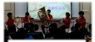
小市府於教師晨會以樂音與詼諧相聲祝福老師