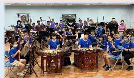
在國樂團合奏中軋一腳