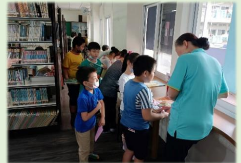
志工們耐心向學生解說抽獎規則