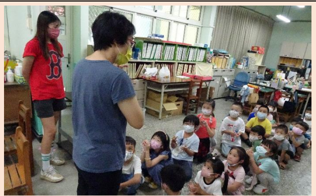
護理師進行衛教，我們很認真聽喔！