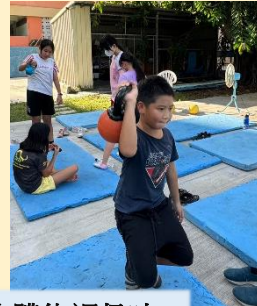
跳水隊趣味體能課