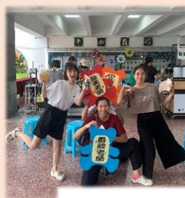
開心合照，感謝校長和會長的關懷