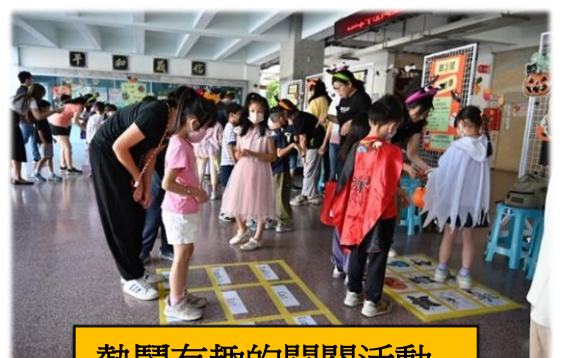
熱鬧有趣的闖關活動