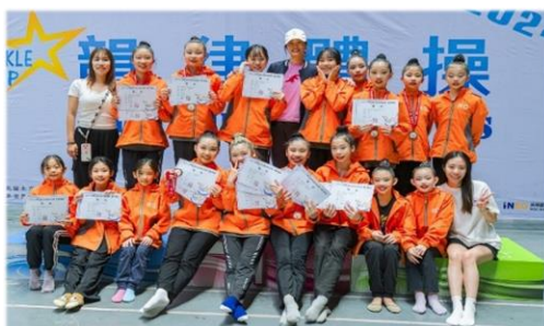
2024 閃耀盃國際體操邀請賽勇奪佳績