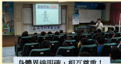
身體界線明確，相互尊重！