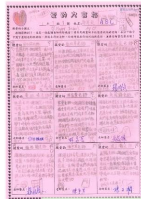
愛的留言寫下對老師滿滿的感恩