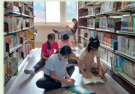
孩子們享受看書的寧靜時光