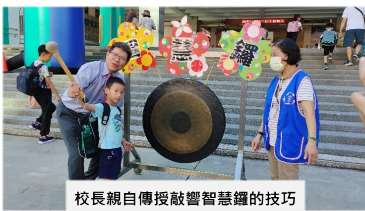
校長親自傳授敲響智慧鑼的技巧