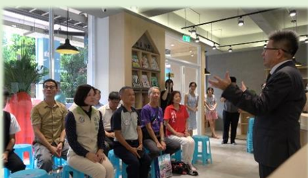
校長介紹藏寶書苑