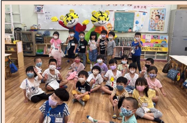
開學第一天，跟可愛的巧虎合照

經過長長的暑假，終於盼到開學囉！本學期幼兒園來了許多新生，我們透過主題教學，讓新生了解學校的環境、適應學校的常規與作息，也讓舊生回顧自己的經驗。老師更設計多元的課程，讓小朋友增進生活自理的能力，增加與同儕互動的機會，進而喜歡上學、適應團體生活，讓小朋友的第一個學習場域經驗是美好的！