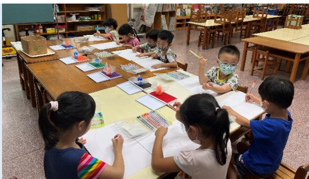
美勞創作~塑膠袋蓋印

幼兒園自辦延長照顧班，老師們會設計有趣的活動，豐富小朋友的生活經驗與啟發小朋友的興趣，讓小朋友在等待爸爸媽媽來接的時候，也會覺得開心喔！