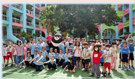
學生開心和高雄熊合照