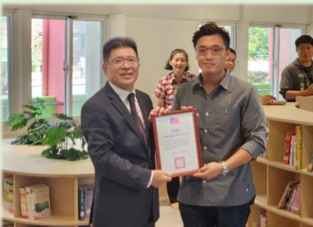
校長致贈感謝狀給施工單位 森築室內裝修工程有限公司