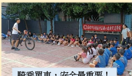
騎乘單車，安全最重要！

為推動全方位的體育課程，學務處結合校內外資源，辦理了各項體育參與活動，包括自行車安全宣導講座、性騷擾性侵害防治、跳水隊趣味體能課程、韻律體操晨光運動。希望藉由多元的活動增加學生學校體育活動的機會，並提高其興趣，達到健康生活化校園的目標。