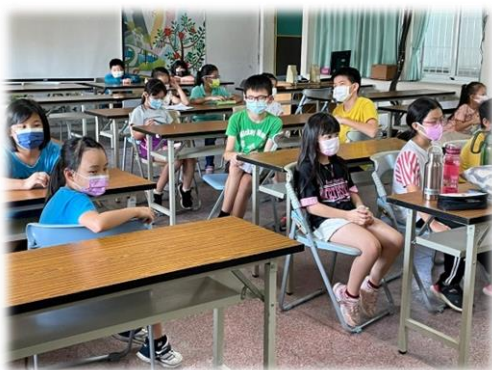
好開心，聽說今天要來錄音