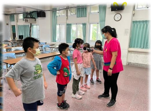
我愛老師！勇敢大聲說出來