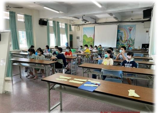
先觀摩別人的橋段如何