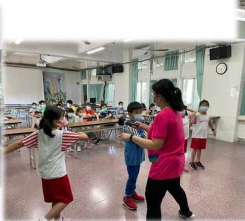
待我先來熱身一下