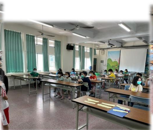
什麼什麼?! 沒有稿子?! 有點緊張