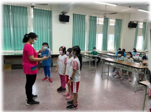
團結就有勇氣！我們互相打氣