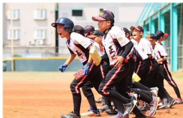
中正，衝啊！我們來了.....