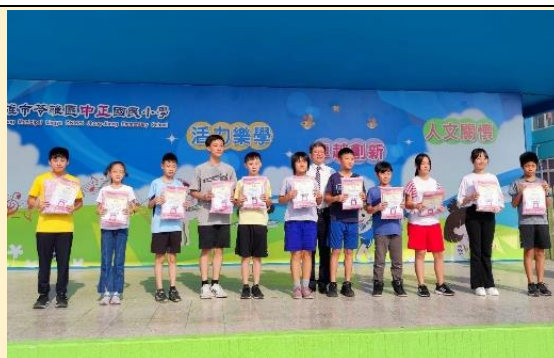
模範兒童與孝悌楷模頒獎表揚