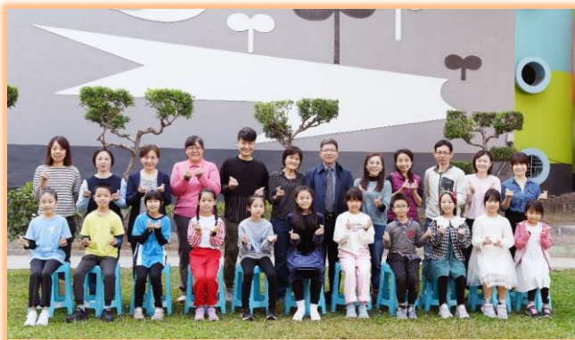
三年級模範兒童與師長合影