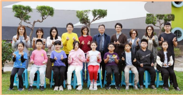
四年級模範兒童與師長合影