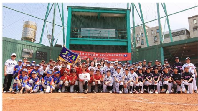
台日友好，以球會友！

本校棒球隊與日本球隊以球會友，切磋球技，觀摩學習日本棒球的文化與訓練方式，彼此語言雖有隔閡，但透過比賽與場下熱情的互動，讓日本球員感受到高雄的熱情，也體驗台灣的生活文化，拓展兩地學生國際視野，增進兩地棒球情誼。