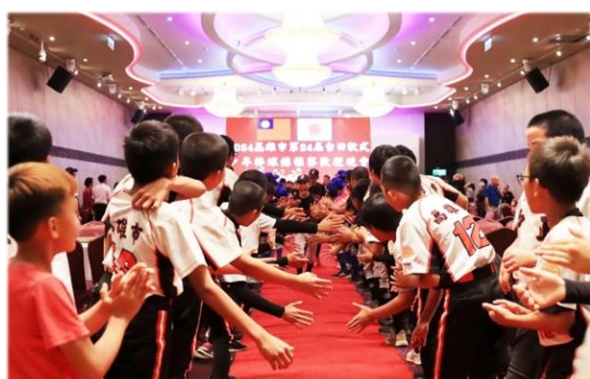
高雄孩子的熱情，燒滾滾！