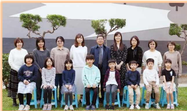
一年級模範兒童與師長合影