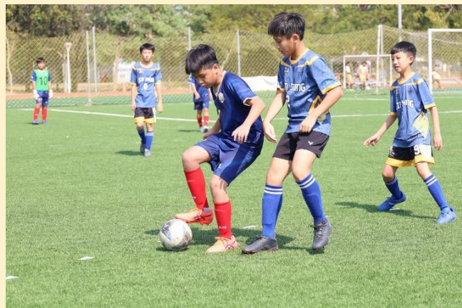
左推右點，當仁不讓！