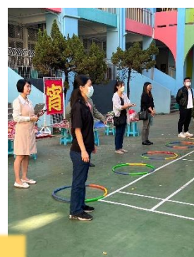
感謝家長會熱情籌畫活動，動員製作平安龜、協助活動進行。