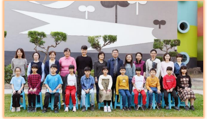
三年級孝悌楷模與師長合影