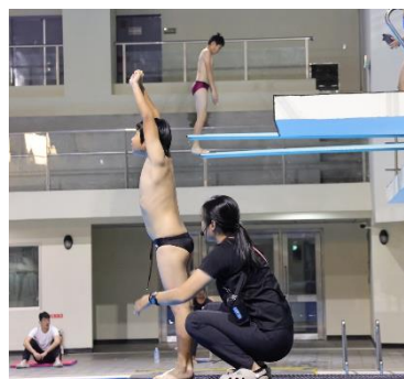
水上基本入水訓練