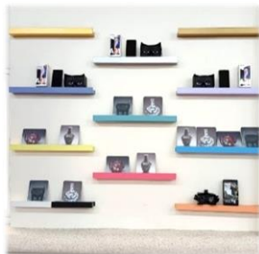
迷你珍寶~~孩子們也愛不釋手