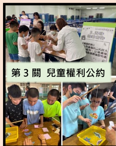
第3關 兒童權利公約