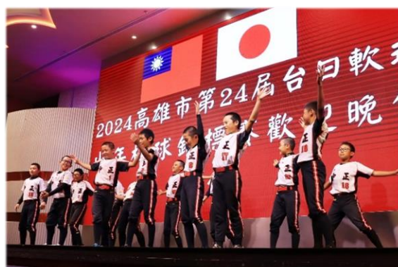
「舞」林高手，盛情歡迎！