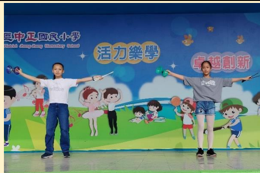
610 小市長團隊扯鈴表演