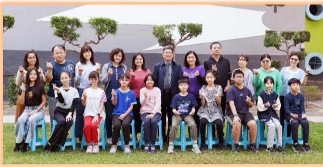
五年級模範兒童與師長合影