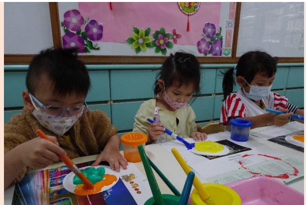
蘋果班~圓的聯想-彩繪圓盤