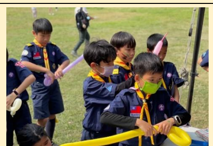
幼童軍們團結合作、卯足全力參加闖關活動