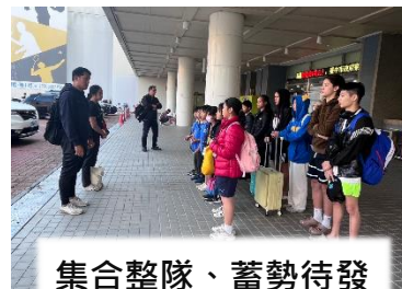
集合整隊、蓄勢待發

本校跳水隊獲高雄市運動發展局的經費補助，於113年2月1日~2日前往臺中市北區運動中心進行移地訓練，讓高雄市跳水隊的小選手驗收平日練習成果，增加經驗，期待在未來的比賽中能獲得更優異的成績。