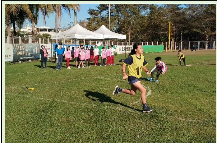
大棒一揮，奔向一壘！