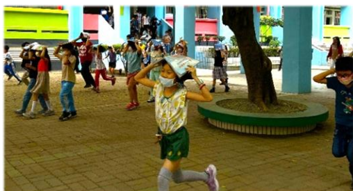
學生井然有序進行疏散