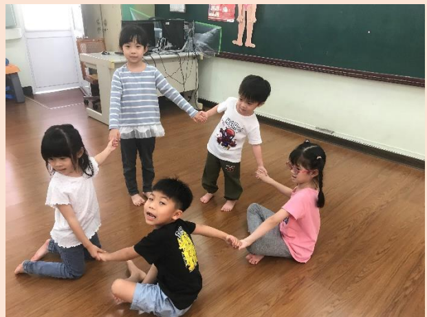
櫻桃班~身體變變變~圓形