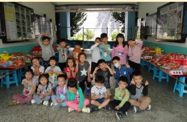
與所有烏龜大合照