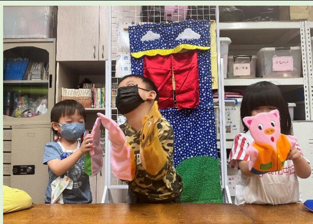
手偶與偶台~語文戲劇扮演