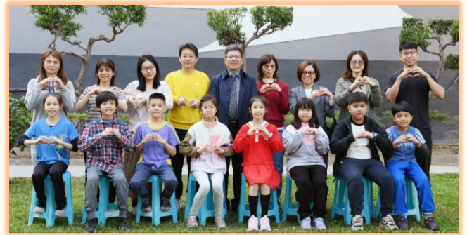
四年級孝悌楷模與師長合影