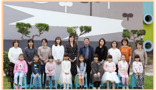
一年級孝悌楷模與師長合影