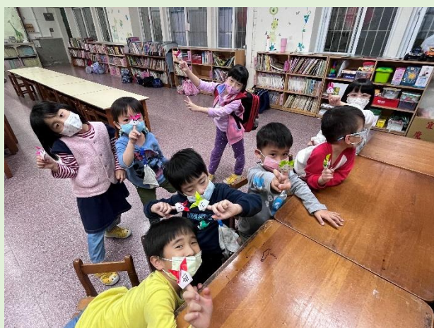
摺紙活動~可愛的小兔