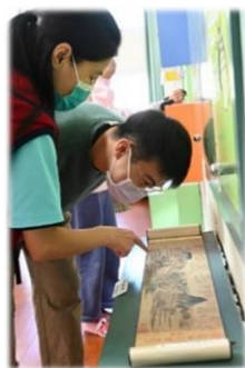
感謝志工協助導覽、詳細說明。