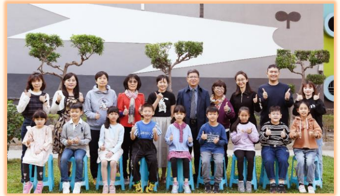
二年級孝悌楷模與師長合影