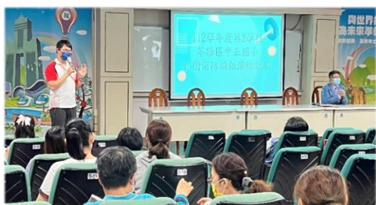
防火管理員說明自衛消防編組的重要性