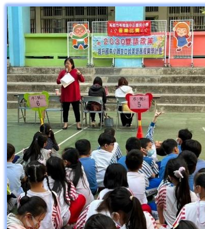
英語歌唱比賽評審講評