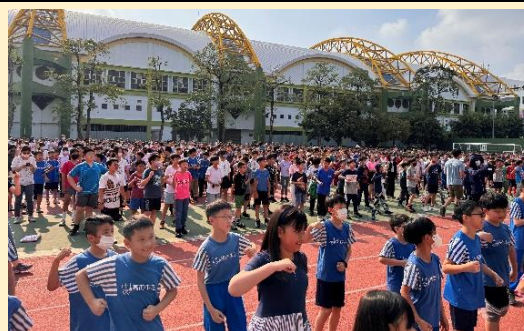
全校活力熱舞，健康動一動