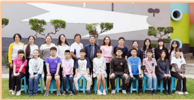
六年級模範兒童與師長合影