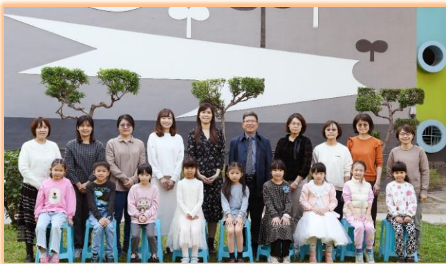
二年級模範兒童與師長合影