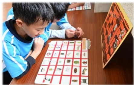
孩子們看得津津有味

教務處引進故宮博物院南部院區與台灣閱讀文化基金會攜手合作的移動博物館，於113年1月16~19日，進行主題教具箱展出。本次展出以清宮多寶格為主要學習內容，帶出各式造型的多寶格與多寶格內收藏的珍玩，讓學生學習收納及展示陳設的藝術，以進一步引導至個人生活上分類與整理物品的應用。移動博物館用心設計的迷你珍玩、3D立體圖卡、VR眼鏡，不只是古代皇帝的賞玩珍寶，也讓幸福的中正孩子們看得津津有味呢！