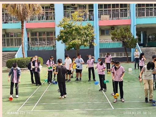
610 舞蹈班學生協助指導同學動作要領