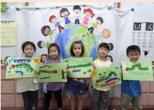
鳳梨班~蓋印畫--好餓的毛毛蟲