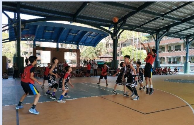
旱地拔蔥，跳投得分！