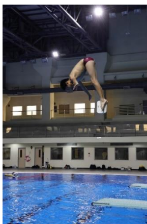
陸上基本入水訓練