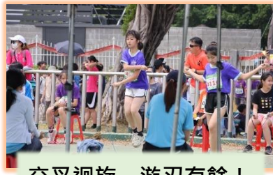
交叉迴旋，游刃有餘！