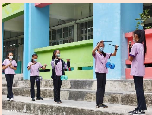
小市長團隊進行扯鈴教學示範