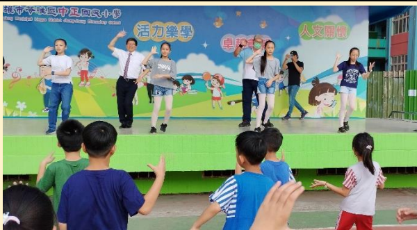
校長、家長會長及小市長團隊與全校活力熱舞