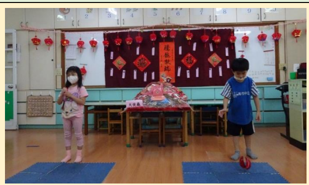
一同乞龜，希望願望成真