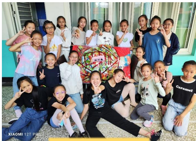
開心和福龜合影留念