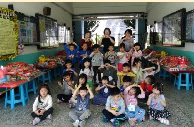
與所有烏龜大合照