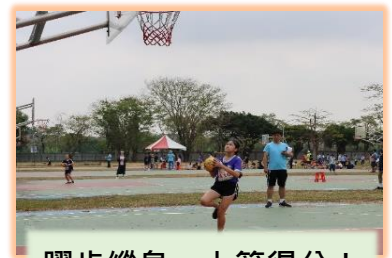
躍步縱身，上籃得分！