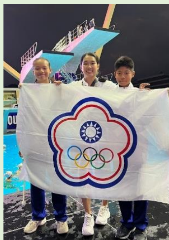
中華臺北跳水隊-中正小將