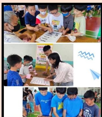
第4關 保護自己有一套