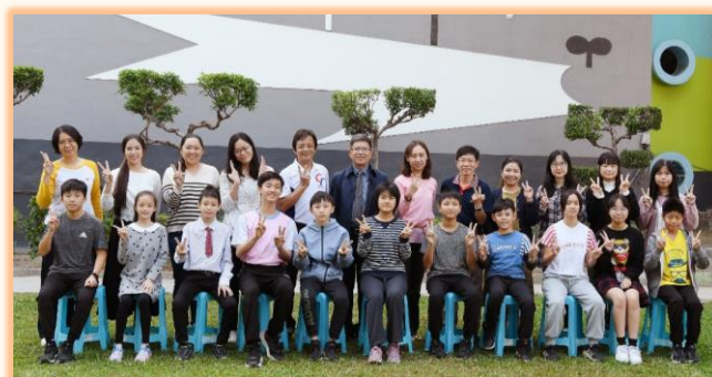
六年級全市模範兒童與師長合影