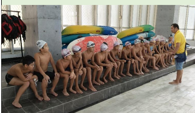
大家聚精會神，聆聽指導！