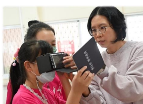
導師熱情支持，陪同看展、細心指導。