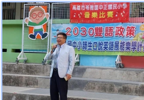
校長致詞勉勵參賽的小朋友