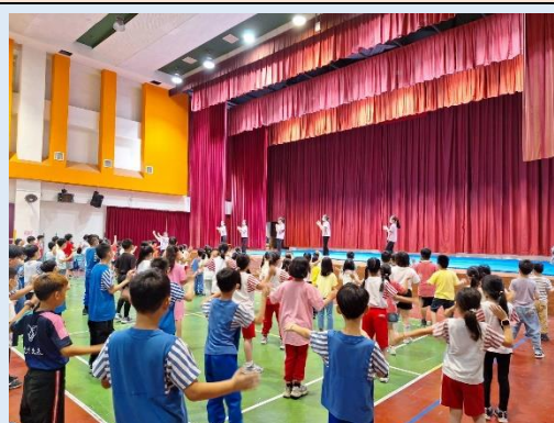
熱鬧有趣的舞蹈教學活動