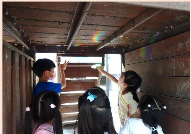
鳳梨班~觀察與實驗--尋找彩虹