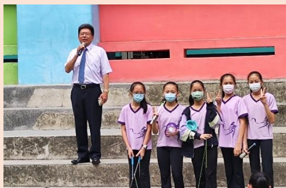
校長為扯鈴教學活動致詞

在兒童節前夕，小市長團隊與該班同學特別於113年3月29日、4月1日舉辦扯鈴與舞蹈體驗活動，擔任小老師，指導有興趣的同學體驗扯鈴與舞蹈的樂趣，將也自己的才藝與大家分享，並推廣藝術文化。