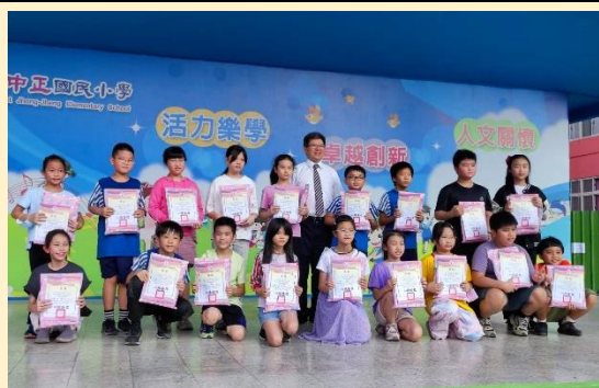
模範兒童與孝悌楷模頒獎表揚