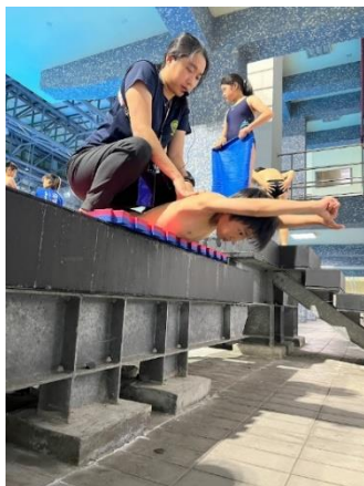
陸上基本入水訓練