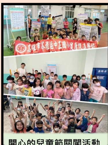
開心的兒童節闖關活動