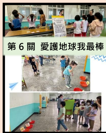
第6關 愛護地球我最棒