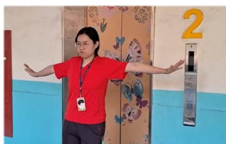
災害發生時禁止搭乘電梯