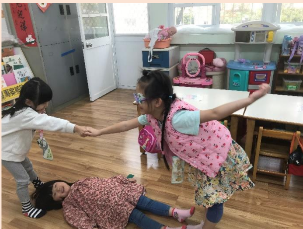
櫻桃班~猜一猜 這是什麼形狀