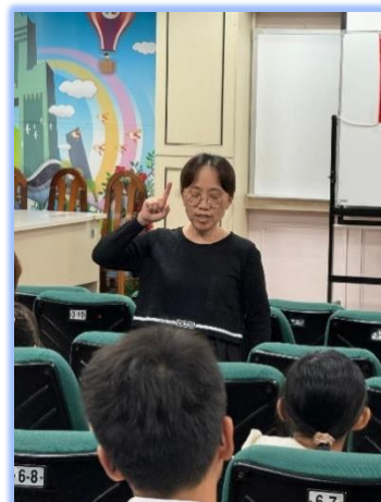
評審老師指導歌唱技巧