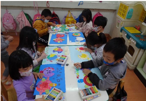
蘋果班~拼貼魚、烏龜的圓型變化貼畫

顏色與形狀是小朋友生活周遭最容易發現的概念，小朋友最早的認知也是從顏色與形狀開始，透過小朋友的生活經驗，我們一起探究形狀與顏色概念，並且設計了許多好玩的活動，讓小朋友發揮創意，操作不同的美勞素材，創作出獨一無二的作品！