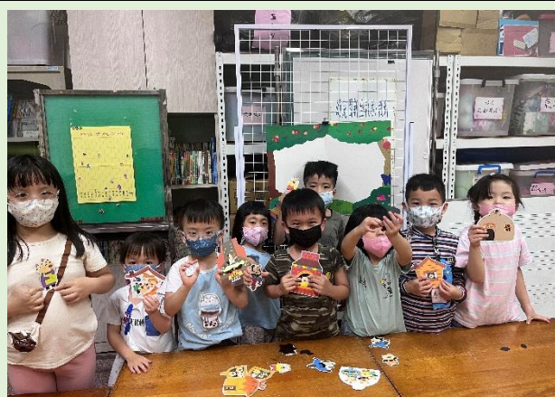
磁鐵偶~我會說故事