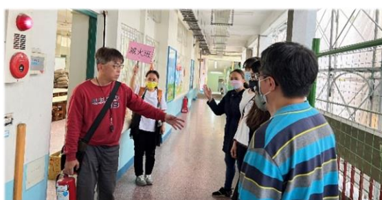
滅火班小組長說明演練重點