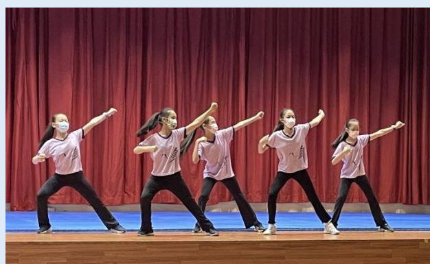
小市長團隊進行舞蹈示範教學