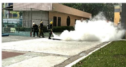
聯合苓雅消防分隊進行滅火演練