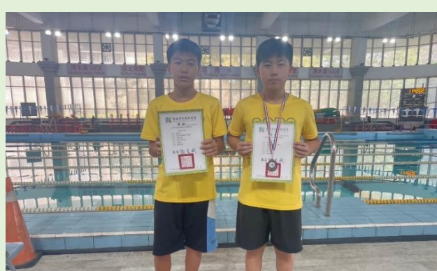
拿獎狀，掛金牌，讚啦！