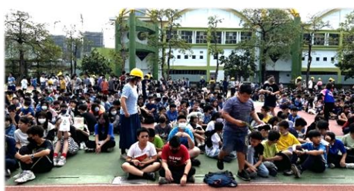
到達集合地點後各班清點人數