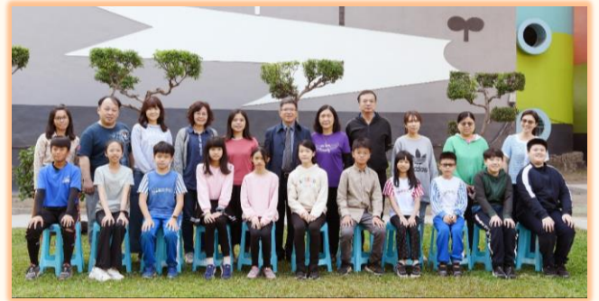
五年級孝悌楷模與師長合影