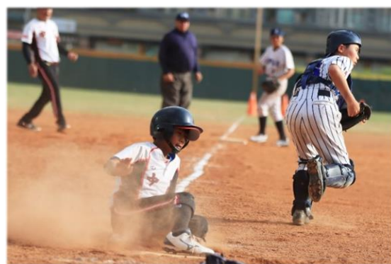
飛快奔回，滑壘得分！