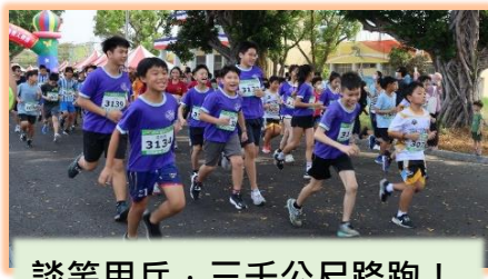
談笑用兵，三千公尺路跑！