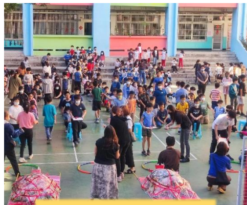
人氣強滾滾的乞龜現場