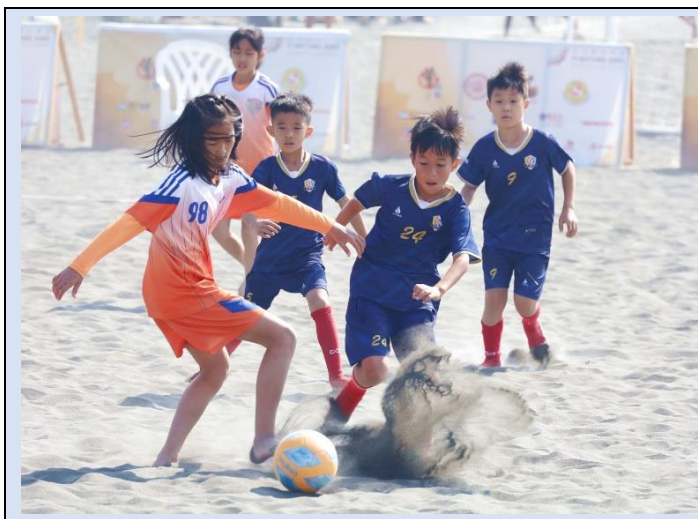
左推右切，全力搶進