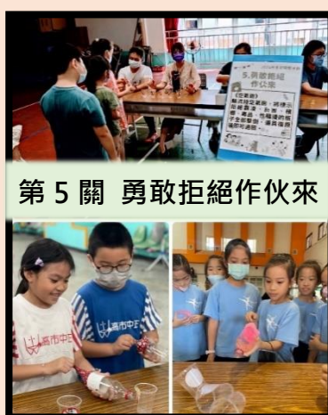
第5關 勇敢拒絕作伙來