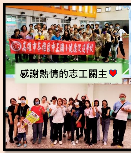
感謝熱情的志工關主