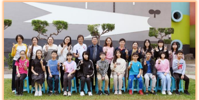
六年級孝悌楷模與師長合影