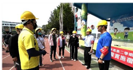
演練後由總指揮校長主持檢討會議

本校為宣導防災概念，增進師生災害防制與應變能力，本學期除於 113 年 3 月 13 日進行自衛消防編組訓練外，另辦理了無預警複合式防災演練。3 月 14 日為預演，3 月 27 日正式演練並聯合市政府消防局苓雅分隊到校支援滅火行動，當天並有委員蒞臨現場指導。委員們見全校師生在學校工程進行中且下課時間發布警報演練，仍能井然有序的完成避難疏散演練，均給予高度肯定。