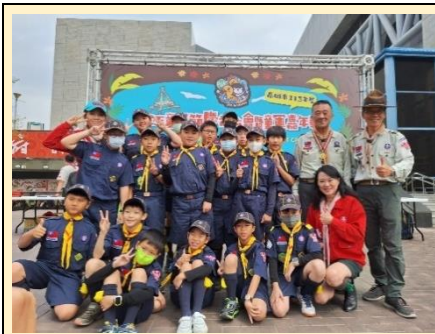
三五童軍節慶祝大會

中正幼童軍於 113 年 3 月 9 日至高雄市科學工藝博物館參加三五童軍節慶祝大會暨童軍嘉年華活動，熱鬧的慶典、機智有趣的闖關活動，幼童軍們均絞盡腦汁、卯足全力，發揮團隊合作精神，成功完成挑戰。