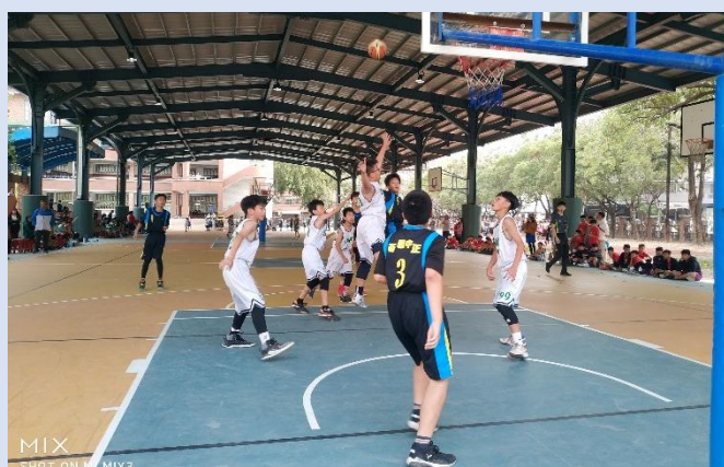
勇闖敵陣，突破重圍！