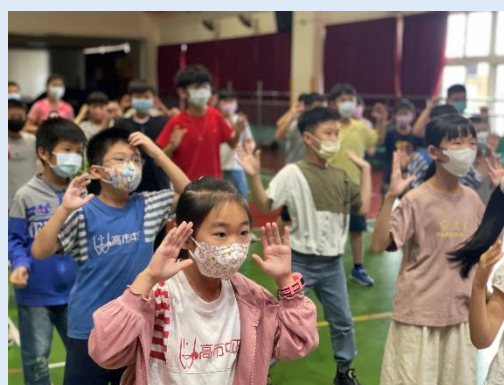
小朋友專注的跟著臺上同學跳舞