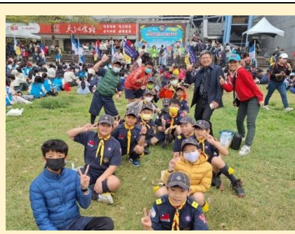
中正小狼 GO! GO! GO!