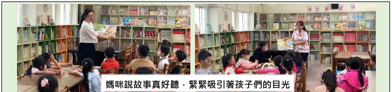
媽咪說故事真好聽，緊緊吸引著孩子們的目光

本學期每日的第二節下課，在一樓圖書室都有圖書館志工的說故事時間，希望藉由說故事，能夠引導孩子們看待事物的思考力，培養表達能力和自信，學會尊重他人不同的觀點，並時時抱持好奇心。歡迎小朋友一同來聆聽！