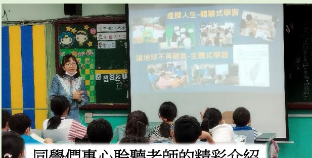
同學們專心聆聽老師的精彩介紹