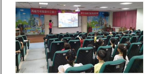
新生始業式請學校護理師進行衛教宣導