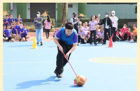
六年級：一路發發發