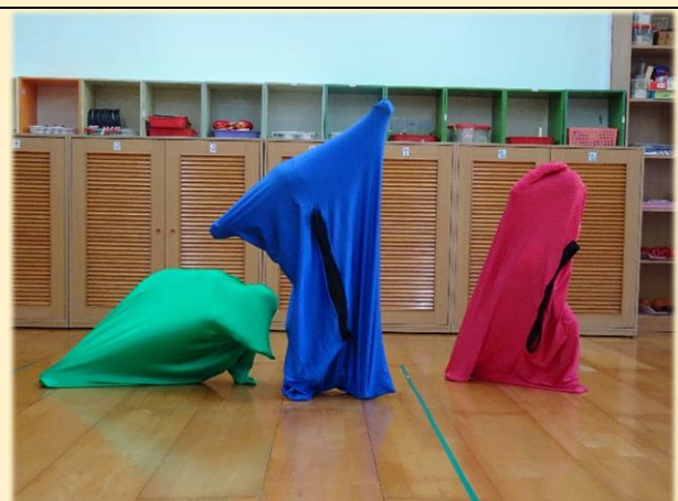
蘋果班~布料與肢體創作