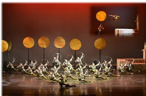
六年級古典舞—羿落九烏