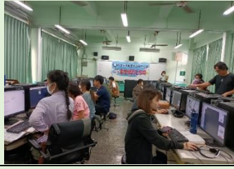
112/11/15 數位素養_資訊安全暨教學資源平台增能研習