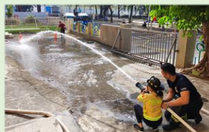
救火英雄--消防體驗