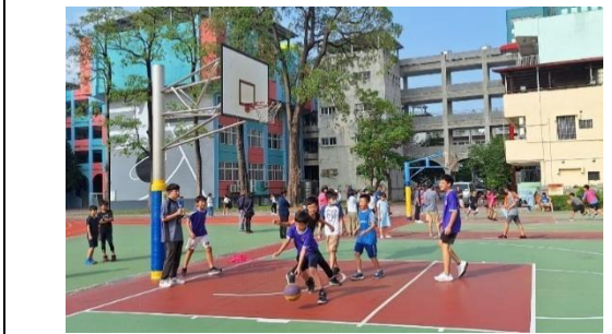
舉辦系列班級體育競賽，鼓勵學生多運動