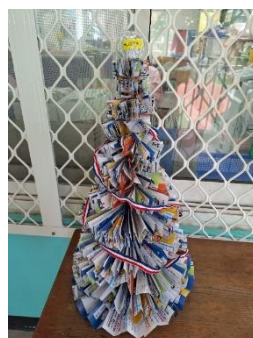
班級作品 (廣告傳單)