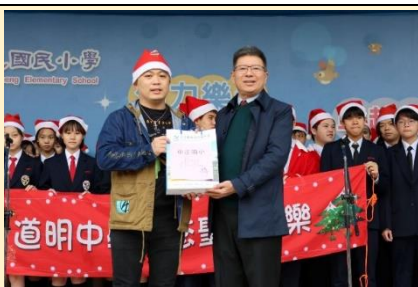
道明中學致贈聖誕卡片

在充滿溫馨的聖誕節前夕，道明中學師生於112年12月21日蒞校進行聖誕報佳音活動，首先同學介紹聖誕節的由來，並透過歌聲與樂聲傳達祝福，外籍教師再以呼口號及活潑的Q&A與學生互動說英文，大家踴躍發表、氣氛熱烈。最後聖誕老公公群登場，大家興高采烈地迎接聖誕老公公的祝福，享受聖誕節歡樂時光。