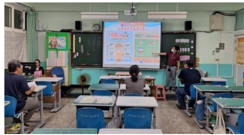
利用班親會進行衛教宣導