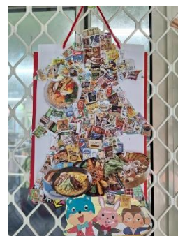
班級作品 (廣告傳單)