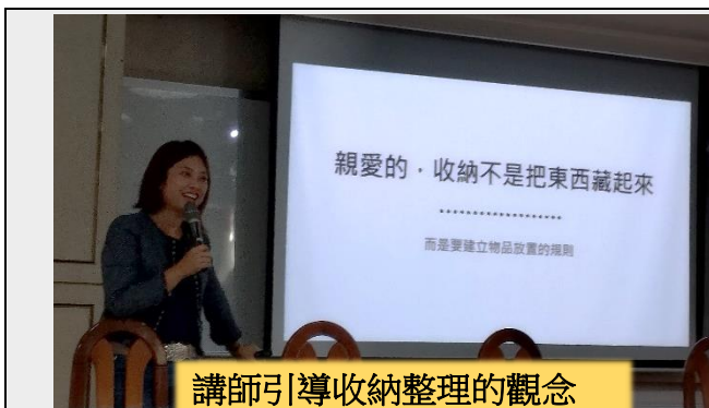
講師引導收納整理的觀念