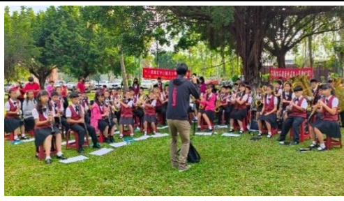
比賽當日賽前練習