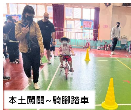
本土闖關~騎腳踏車