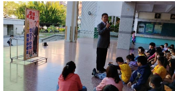
校長提醒學生交通安全注意事項