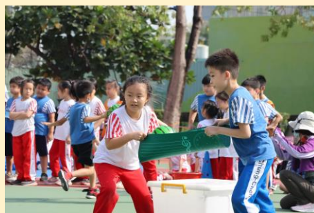
二年級：比同心，比協力