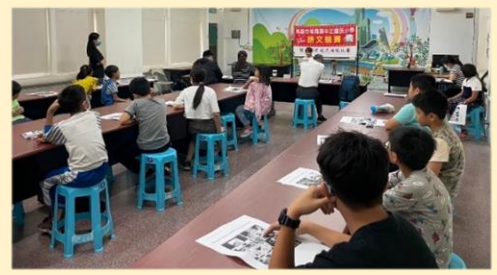
閩南語情境式演說比賽