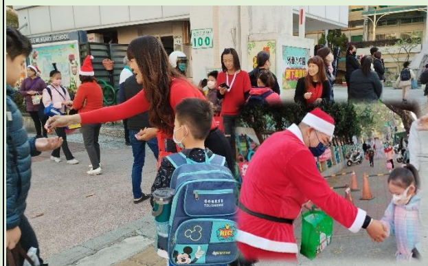
家長會陳會長扮成聖誕老人和家長委員們在校門口發放糖果給小朋友