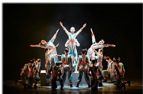
六年級現代舞-元宇宙

112 學年度中正國小・苓雅國中舞蹈藝才班教學成果發表會，於 112 年 12 月 27 日在高雄市文化中心至德堂舉行。舞展主題為「拾舞」，傳達舞者掙脫了新冠疫情的桎梏，重「拾」對「舞」的初心，再次燃燒青春熱血，恣意飛舞。整場展演題材多元豐富、橫跨古今，舞碼精采，扣人心弦。舞者們更以紮實的基本功與豐富的肢體語言，充份演譯作品內涵，博得與會嘉賓們的一致盛讚與熱情的掌聲。