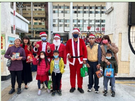
小朋友開心和聖誕老公公們合影