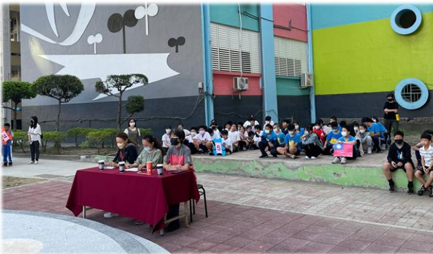
別開生面的戶外歌唱比賽

在音樂科任和級任老師的通力合作下，小朋友們對運動歌都能朗朗上口，比賽時精神抖擻，嘹亮的歌聲響徹晴空下的林間，為校園增添十足的活力。