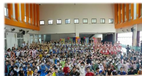
舞者與觀眾熱情大合照