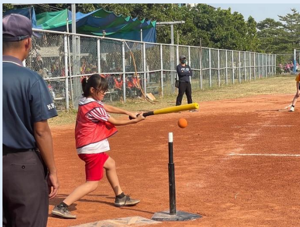
大棒一揮，安打，安打！