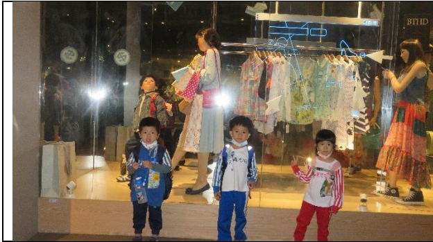
看「衣技織長」內不同的衣服

112年12月21日幼兒園配合教學主題~花花衣裳，到科工館進行校外教學。科工館中有許多科學類的展廳與體驗活動，奇幻國與夢想號都非常適合小孩，小朋友可以從做中學學習，在遊戲操作中得到自然科學的資訊。在衣技織長中，認識過去和現在的服飾差異、製作衣服的材料…等，讓孩子們在這次的校外教學中得到滿滿收穫！