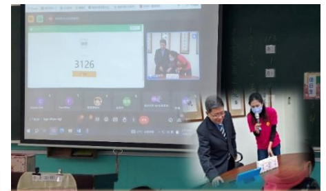
響應環保，採線上方式摸彩