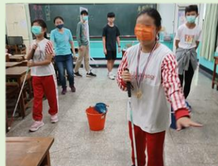
迎向光明- 特教體驗