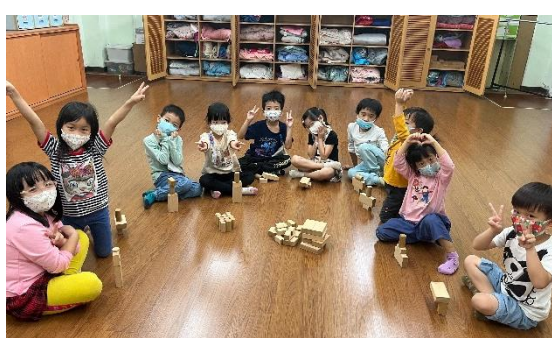
空間創作~以不同形狀積木堆疊作品

幼兒園延長照顧班的老師們在112年11、12月設計有趣的體能活動、美勞活動、音樂律動、語文啟發…等，豐富小朋友的生活經驗，並啟發小朋友的興趣。