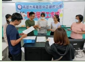
112/12/6 數位素養_AI繪圖數位教材製作增能研習