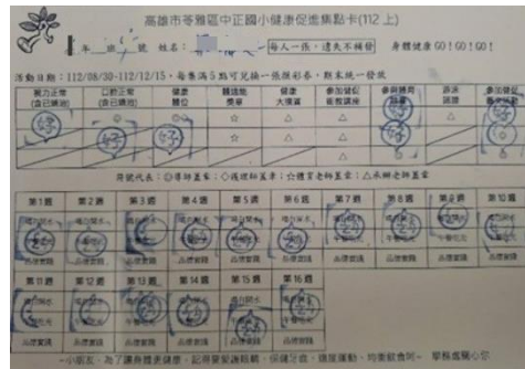
健康促進集點卡方便學生進行集點