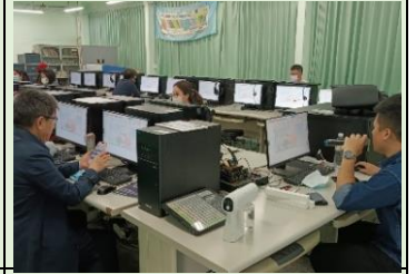
112/12/20 Team Model 醒摩豆 HiTech 智慧教學系統