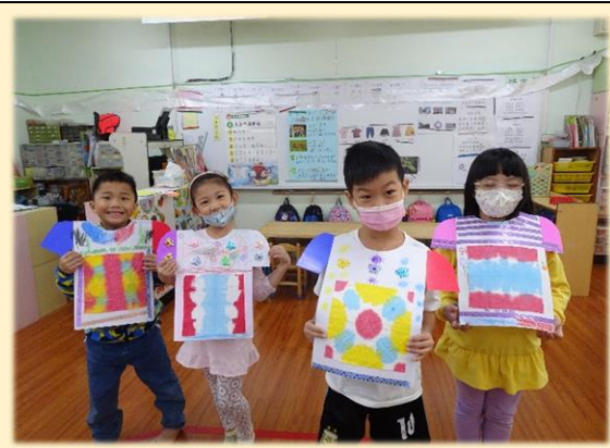
鳳梨班~動手設計衣服