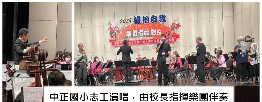
中正國小志工演唱，由校長指揮樂團伴奏