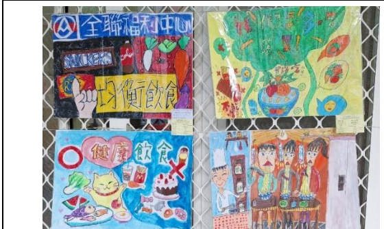
舉辦小樂活健康講座，培養健康飲食觀念