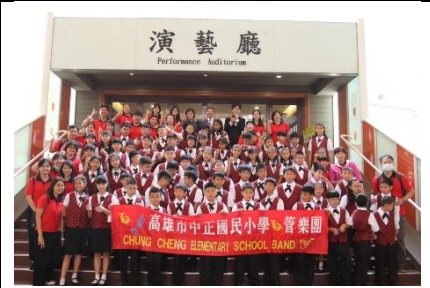
全團親師生大合照