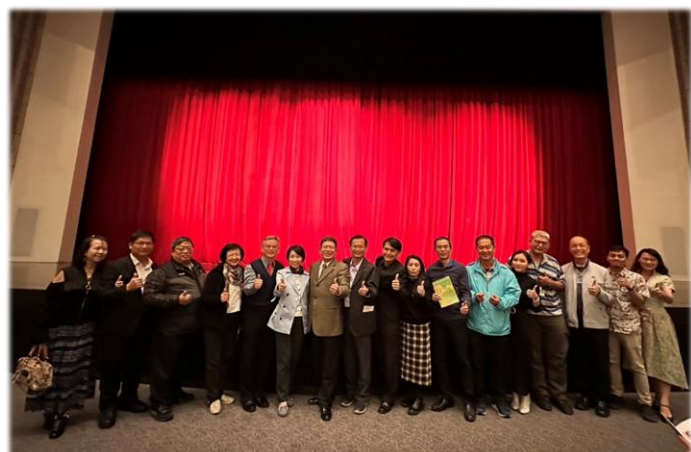
校長和與會長官嘉賓合照