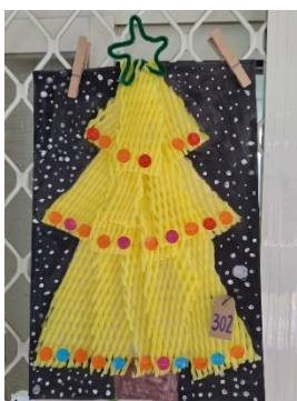
班級作品 (水果套袋)