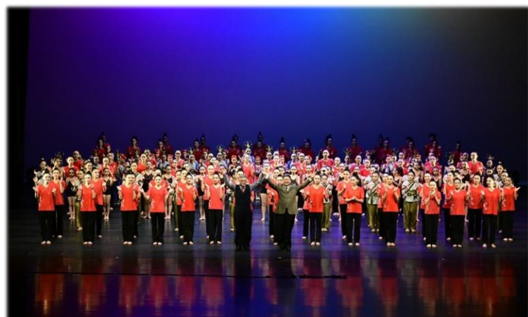
演出成功 光榮謝幕