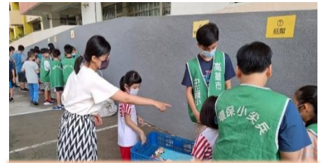
級任老師協助指導回收

學務處於112年12月6日~27日辦理廢電池回收摸彩活動，透過宣導與回收競賽建立學生廢乾電池回收知識與觀念。活動期間統計班級廢電池回收總重量，取績優班級進行表揚。學生每蒐集20顆廢電池或20片光碟片，可得一組摸彩號碼參加個人摸彩抽獎。於113年1月4日學生線上朝會進行抽獎，由校長抽出幸運的得獎者。