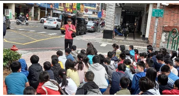
在校外人行道上進行實地講解