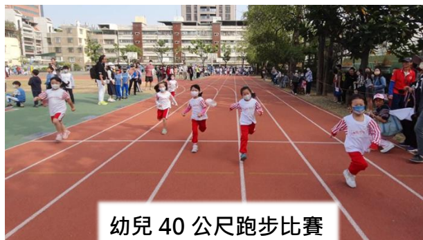
幼兒 40 公尺跑步比賽