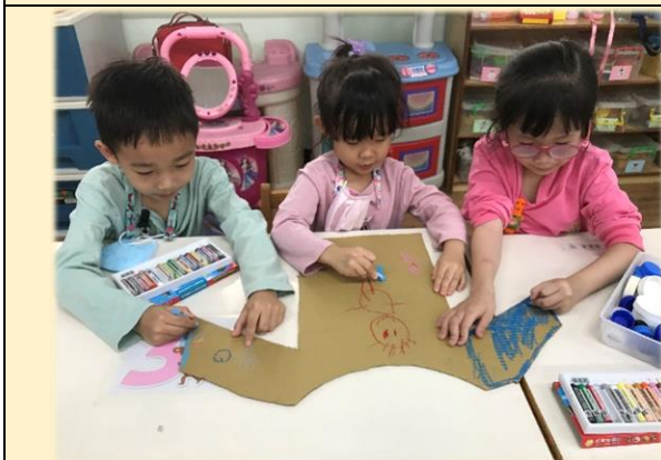
櫻桃班~小小服裝設計師