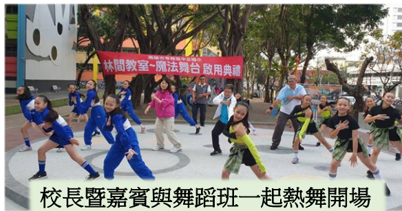
校長暨嘉賓與舞蹈班一起熱舞開場