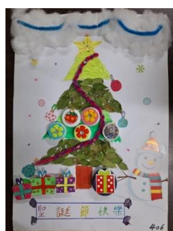
班級作品 (複合式媒材)