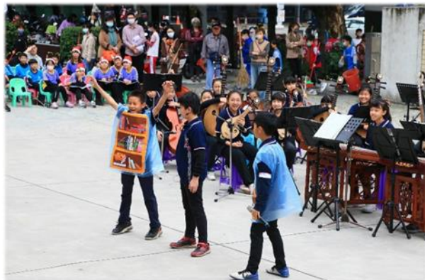
台風穩健的演員們