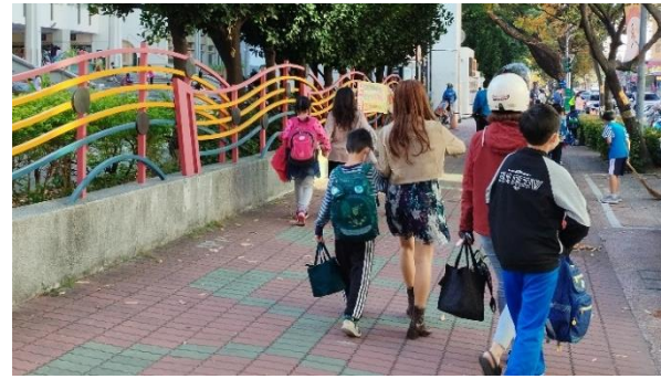
After 機車不上人行道 通學步道好順暢

經過一連串的宣導及教育後，本校人行道的秩序大有改善，家長及社區人士多能配合不將機車騎上人行道，讓通學步道成為真正安全的空間，謝謝大家配合一起守護我們的孩子。