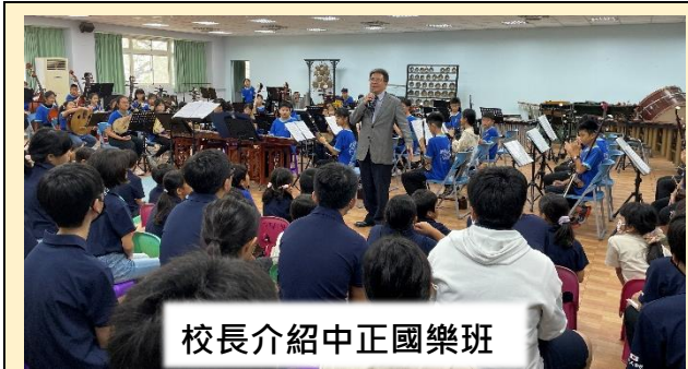
校長介紹中正國樂班