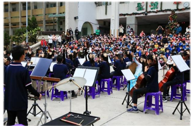
熱鬧高人氣的音樂會現場