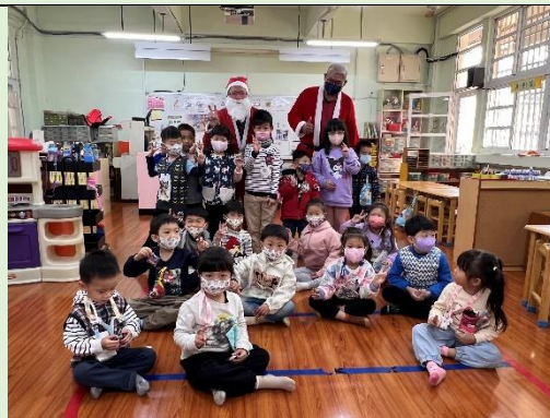
校長和會長二位聖誕老公公帶著禮物，送上歡樂給每位幼兒園小朋友。