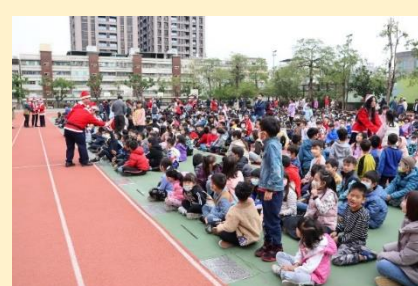
聖誕老公公群出場