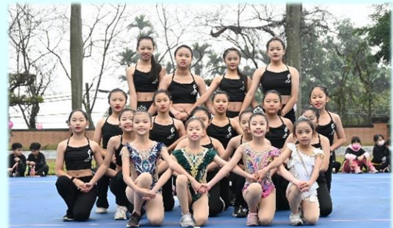
體操小精靈參與校慶運動會表演活動