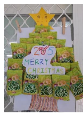
班級作品 (餅乾包裝袋)