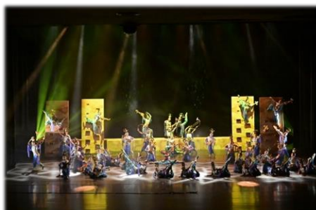
四、五年級古典舞-千古一念