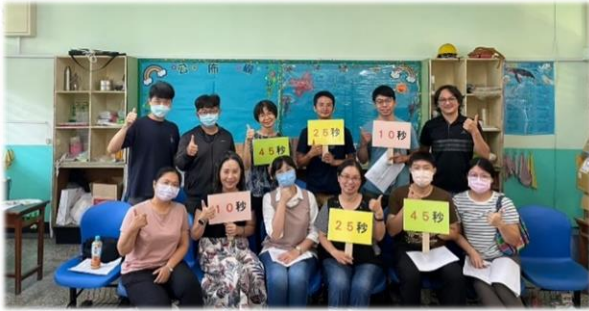
種子工作人員及監場人員培訓

高雄市教育局承辦112年全國語文競賽，本校協助辦理本土語讀者劇場賽務部工作，由教務處統籌工作人員招募，辦理工作人員研習兩場培訓。歷經一年的賽事籌備，終於在112年11月25日辦理完竣，順利圓滿完成任務！