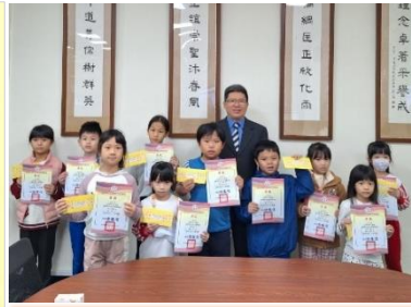
廢電池回收總重全校前十名，頒發禮券