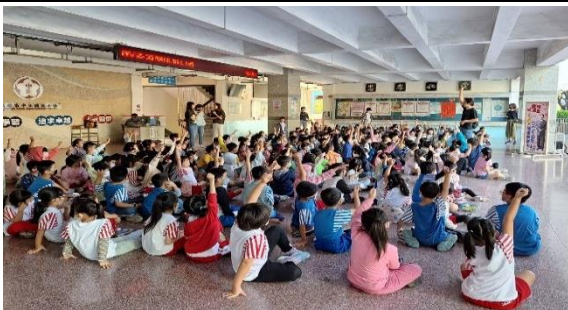
學生熱烈搶答老師的提問