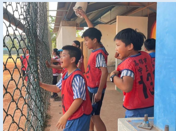
最賣力的應援團，神隊友！