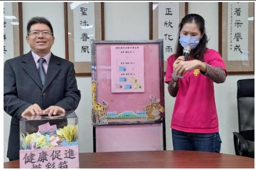
利用線上升旗時間進行摸彩