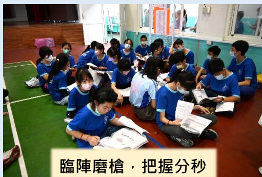
臨陣磨槍，把握分秒