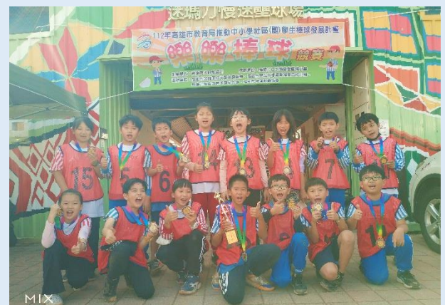
開心贏得季軍，明年朝冠軍邁進