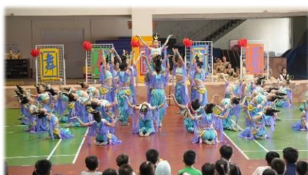
四、五年級古典舞-千古一念