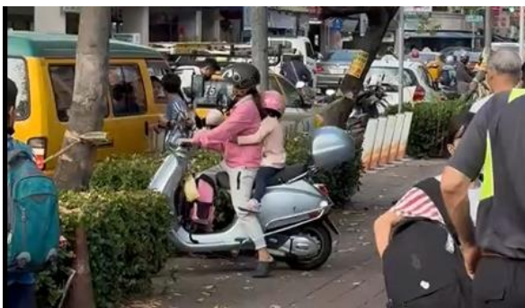
Before 接送孩子習慣將車子騎上人行道