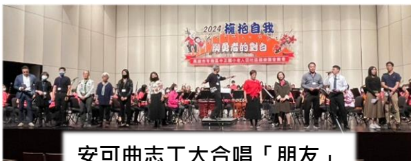
安可曲志工大合唱「朋友」