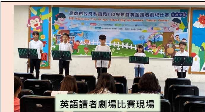
英語讀者劇場比賽現場