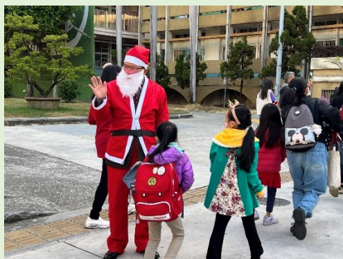
校長一早扮成聖誕老公公和大小朋友打招呼

「雪花隨風飄……」112年12月25日聖誕節當日上午，聖誕老公公帶著歡喜糖來到中正國小，帶動節慶的熱鬧氣氛。感謝家長會的支持與全力動員，把溫馨歡樂散播在中正校園。