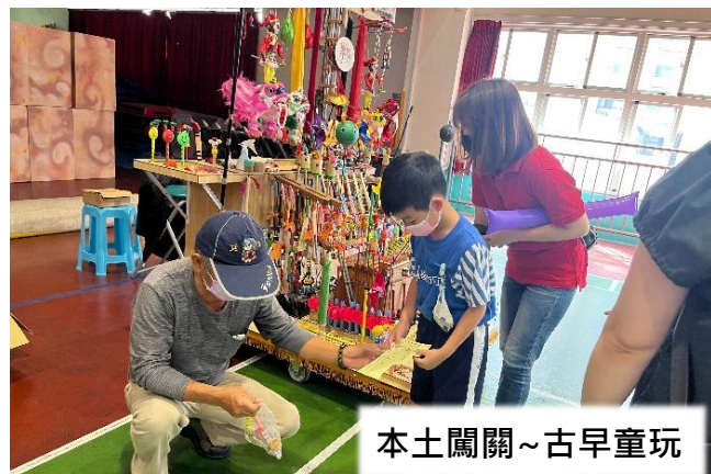
本土闖關~古早童玩