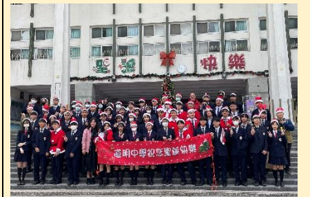
道明中學師生合影