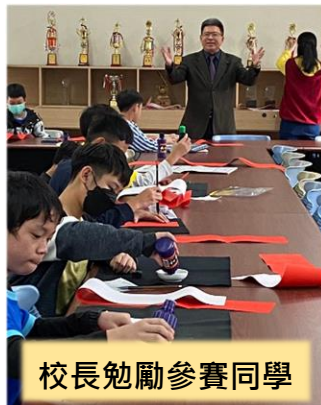
校長勉勵參賽同學

為弘揚傳統書法藝術，鼓勵培養年輕書法家，教務處於 112 年 12 月 26 日配合新春節慶，舉辦甲辰迎春春聯書法比賽。