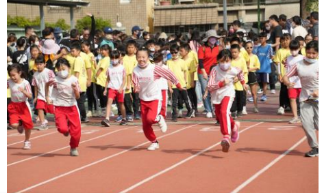
全員賽跑—摩拳擦掌，全力以赴。衝啊！獎牌，我來了.....