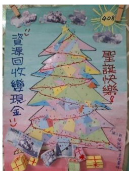
班級作品 (數學附件)