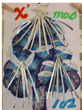
班級作品 (優格封膜)

學務處於112年12月1日~12月25日推出「環保聖誕樹創作」活動，由各班學生利用生活中的廢棄物創作一棵環保聖誕樹，小朋友們充份發揮觀察力與創意，尋來五花八門的各式材料，利用其特質，化腐朽為神奇，創造出件件令人驚艷的作品。