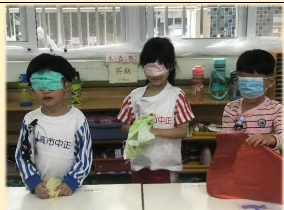
櫻桃班~猜一猜，這是什麼布？