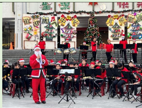
聖誕老公公帶著管樂團祝福大家聖誕快樂