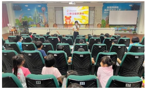
結合相關主題舉辦繪畫比賽