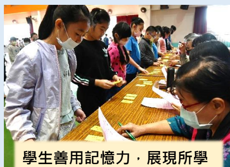
學生善用記憶力，展現所學