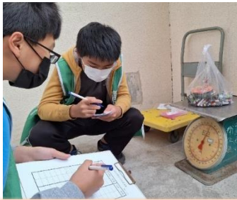
環保小尖兵協助廢電池秤重及統計