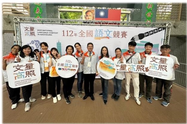
工作人員賽後合影

文星高照 2023 NATIONAL LANGUAGE CONTEST IN KAOHSIUNG