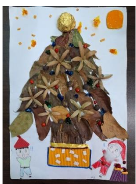
班級作品 (大自然媒材)