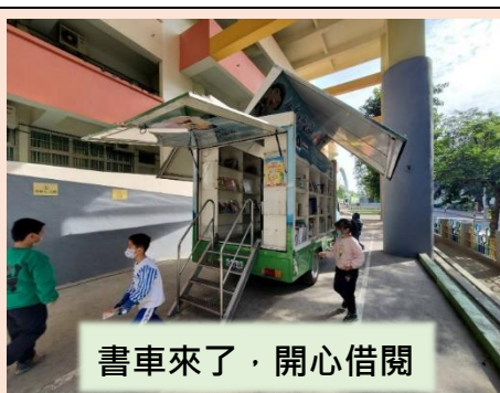
書車來了，開心借閱