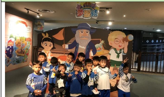
在夢想號中可以操作不同教具喔！