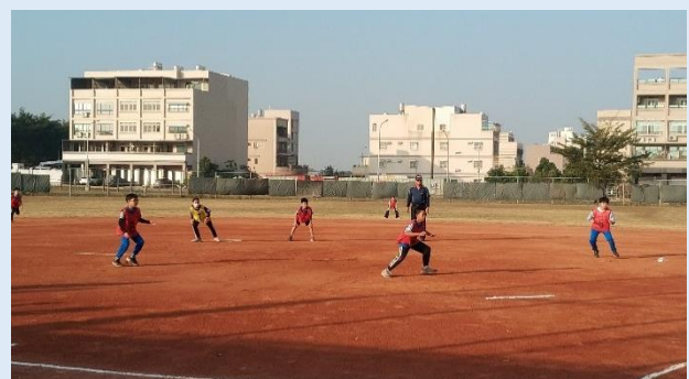
嚴陣以待！放馬過來！