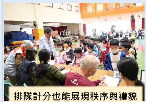
排隊計分也能展現秩序與禮貌

教務處配合學校「閱讀悅心-讀經教材」校訂課程，於112年12月18日~20日舉辦讀經闖關活動。本學期讀經闖關活動共有1367位同學獲得「讀經狀元」，非常感謝各班老師、行政處室，以及熱情的志工們，感恩大家的大力協助，一同見證孩子們的努力與成長。