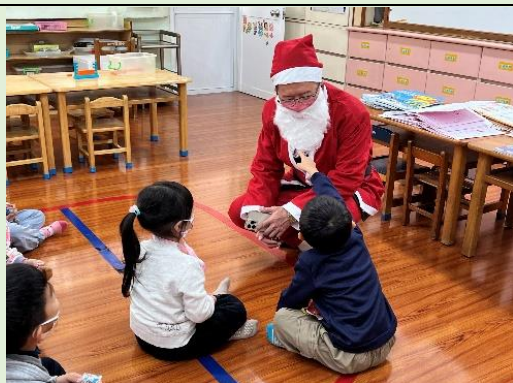
聖誕節最溫馨的一角~慈祥聖誕老公公聆聽著幼兒園小朋友們的童言童語。