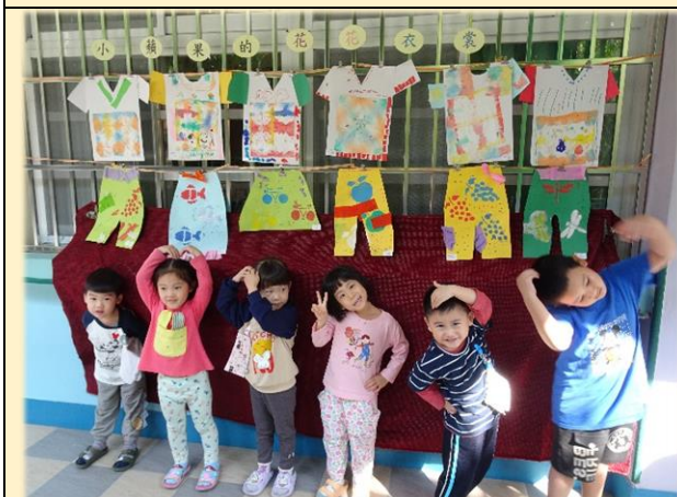
蘋果班~小小設計師創作衣褲與裙子