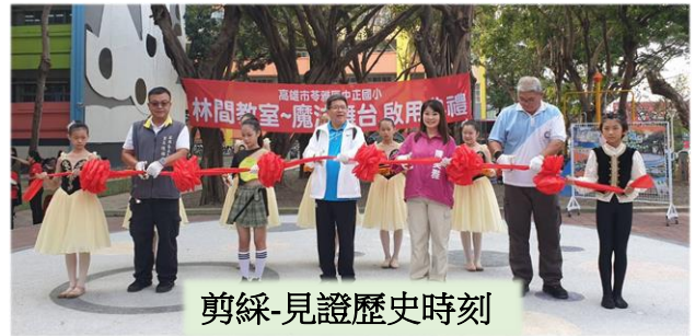
剪綵-見證歷史時刻