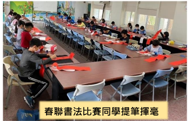
春聯書法比賽同學提筆揮毫