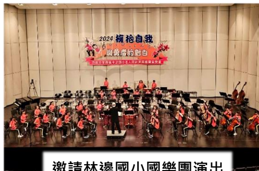
邀請林邊國小國樂團演出