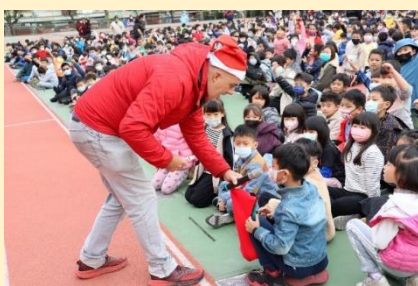
外師 Q&A 有獎徵答互動