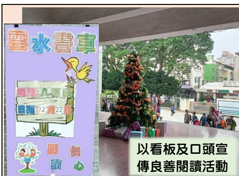
以看板及口頭宣傳良善閱讀活動