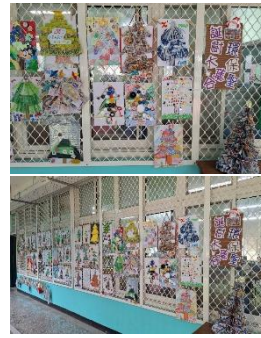
將班級作品布置 在學務處走廊， 供全校欣賞