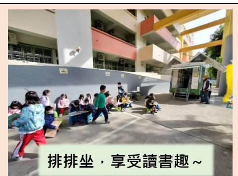
排排坐，享受讀書趣~

112年12月22日佛光山的行動書車「雲水書車」，載著滿滿的圖書來到學校，小朋友們三五成群坐在建民庭，體驗不一樣的閱讀經驗。