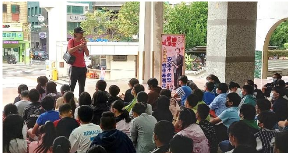
生教組長進行交通安全宣導