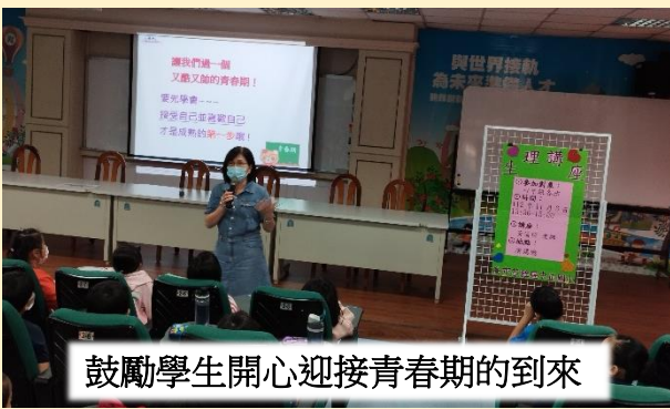
鼓勵學生開心迎接青春期的到來