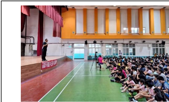
期初利用線上升旗時間說明活動內容

學務處為提倡健康生活型態，以集點活動方式辦理健康促進教育。本學期的健康促進集點活動於112年8月30日~12月15日期間辦理。藉由活動培養學生養成良好的生活習慣，如視力保健、降低齲齒率、多喝白開水、飲食均衡等，也鼓勵班級參加衛教宣導以及相關體育、藝文競賽。另外，助人行善、品德實踐亦可獲得健康促進點數。期末，學生可將點數兌換成摸彩券，參加摸彩活動，寓教於樂。