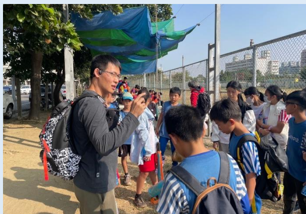
賽後檢討，下次更好！