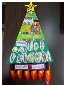
班級作品 (複合式媒材)