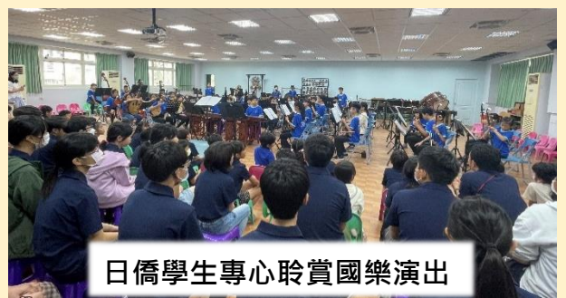
日僑學生專心聆賞國樂演出

112年12月8日本校國樂班與日僑學校進行文化交流，日僑學校學生至國樂教室聆賞國樂班同學演奏傳統樂曲。