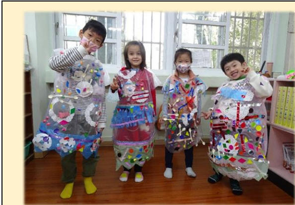
鳳梨班~小小設計師

幼兒園的第二個主題活動是花花衣裳，透過主題活動，讓小朋友認識布的種類、衣服的樣式…，進而設計衣服，培養美感、語文能力、數學測量…等，各班老師依據孩子的能力與發展，設計各領域的活動，讓小朋友們透過實際體驗與遊戲的方式，將概念內化、成長！